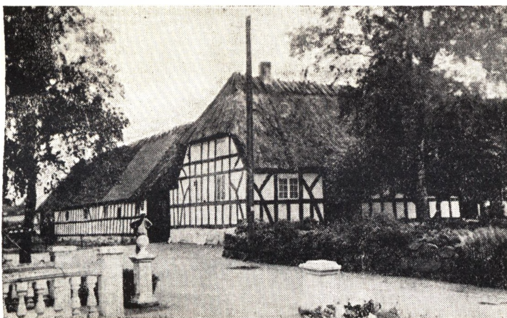
Cornelius Petersens Gaard

Efter Sanderumbaards Jordebog af 1. Maj 1828 bestod Davinde By af 12 Gaarde og Davinde Mølle. De solgtes i Tiden Marts—December 1829, og Købesummen laa mellem 1600 og 2100 Rigsdaler.