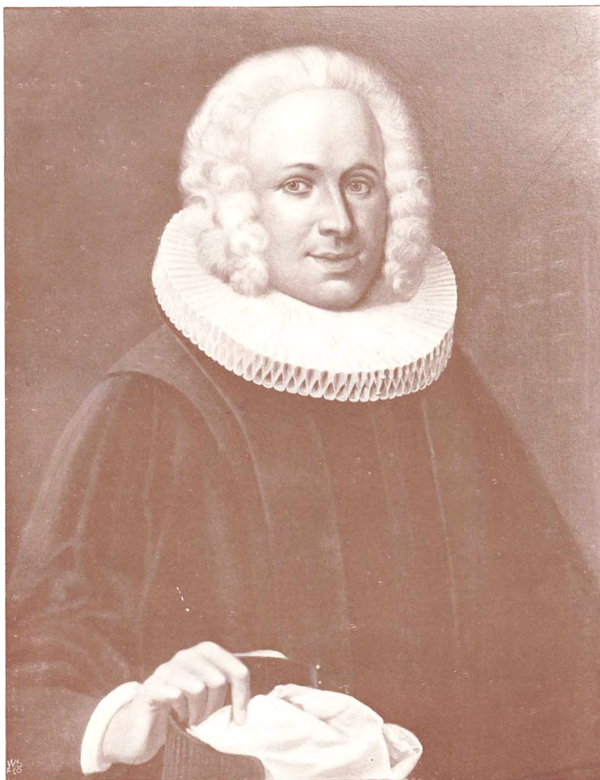
RASMUS PLATOU, SOGNEPREST TIL DAMSHOLTE født 1708, død 1775, alle norske Platou'ers stamfar. [Original-portræt i Damsholte kirke paa Møen.]