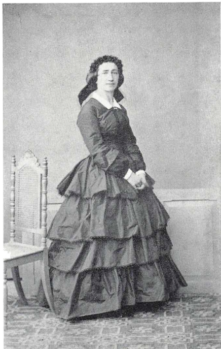
Johanne Luise Heiberg München 1862