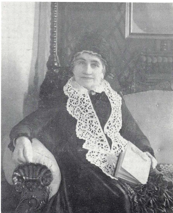
Johanne Luise Heiberg 1882