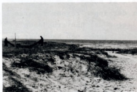
Udsigt mod molen fra den gamle e- getræsbeak ved fiskernes stråttækte ishus. Foto ca. 1940.

Dengang havde kun få af Lise- lejes sommerhusejere vandværk-