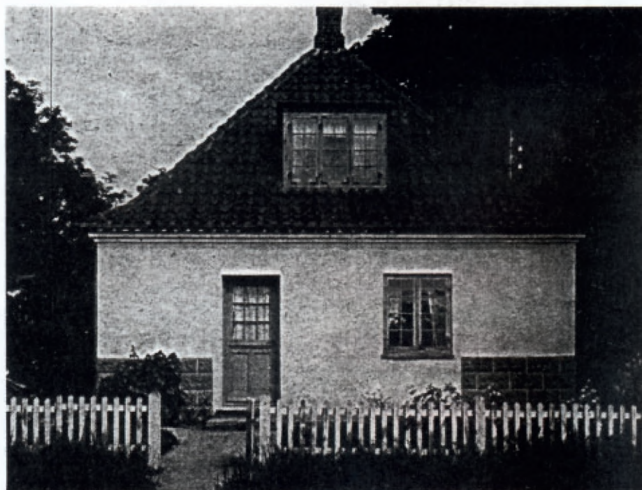
Huset på bakken, som nu er revet ned. Fotokopi af ældre fotografi.

get opad, men det hjalp vist ikke meget. Jeg var lykkelig i Farum, men huset vi boede i var meget usundt, så vi var altid syge. Jeg klarede det bedst, fordi jeg elskede levertran, og det hjalp mig. Ved siden af os var asylet, hvor jeg holdt meget af at opholde mig og høre fru Nielsen læse historier. Udenfor Asylet var der en dejlig