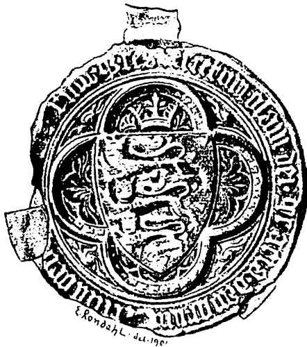
Kong Oluf 3.s våben fra 1376. Første danske våbenskjold med kongekrone over.

fabeldyr eller „rigtige“ dyr som løver og ørne. De enkle figurer var beregnet på at kunne opfattes hurtigt, på lang afstand og måske i kamptummel. Våbenmærkerne blev efterhånden arvelige inden for slægten, ligesom der med tiden opstod et fast og detaljeret system for mærkernes udformning og brug.