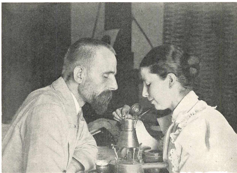
Kaffen tilberedes i Ægypten