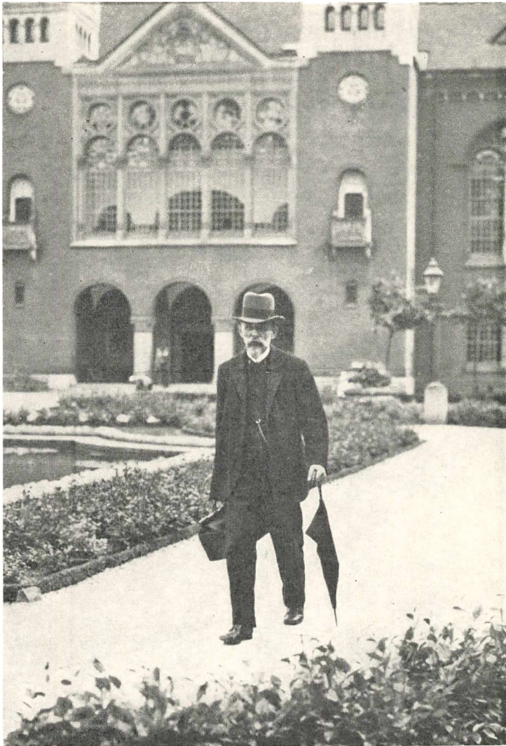
På vej fra Det kgl. Bibliotek