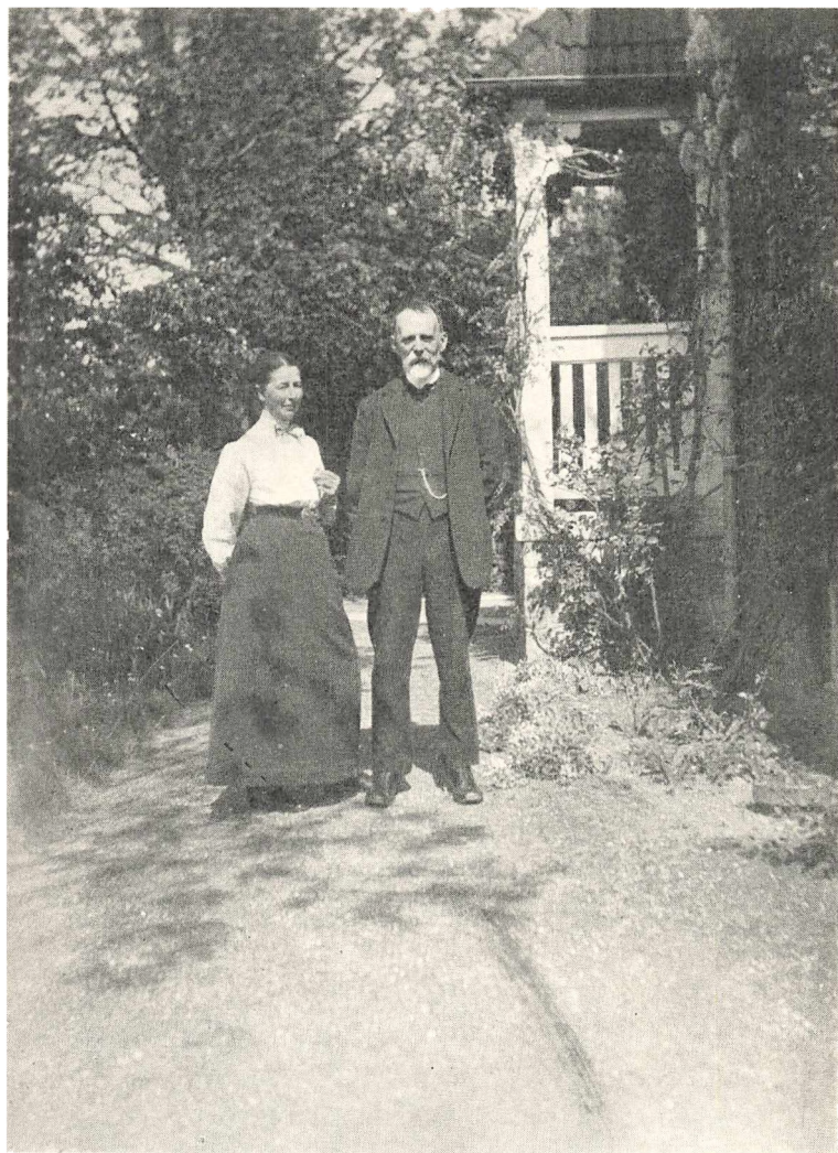
I haven i Gentoftø