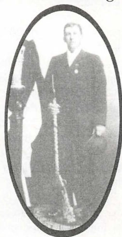
ÅRBOG 1982 · FREDERIKSBORG AMTS HISTORISKE SAMFUND