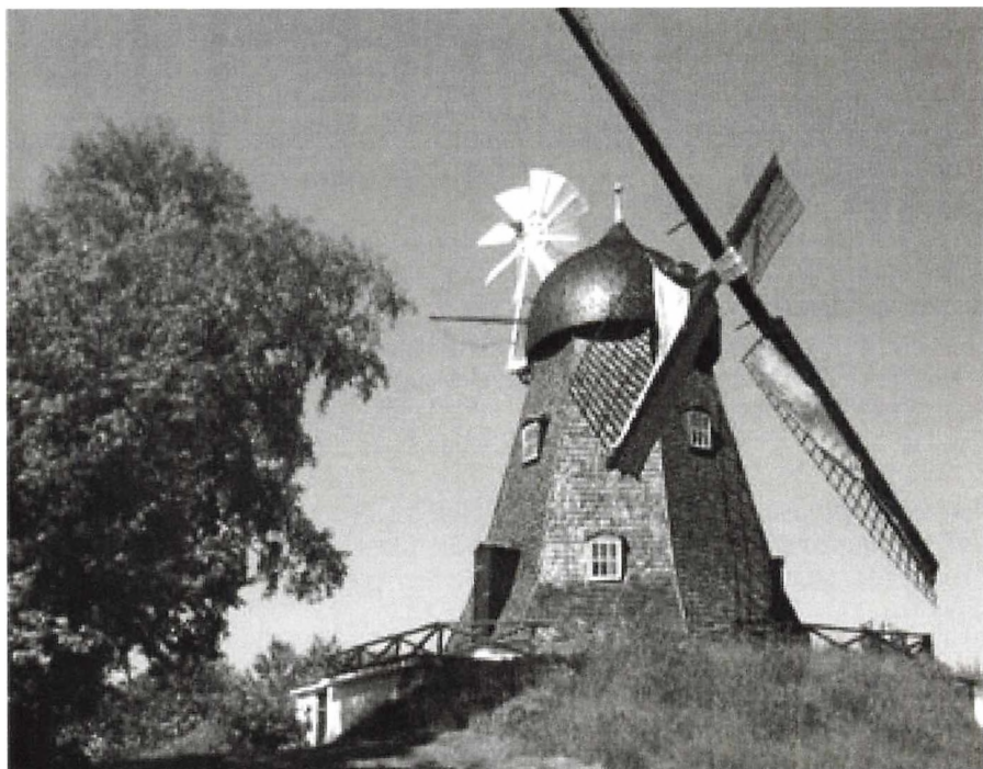
Højsager Mølle.