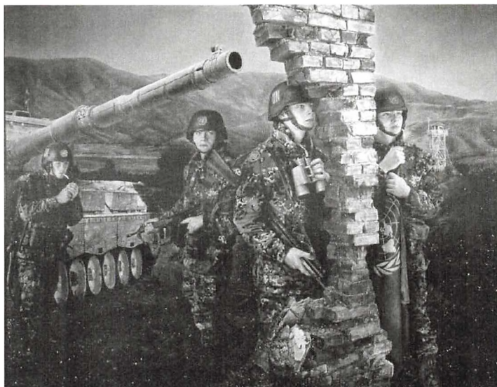
Danske FN tropper i Bosnien 1995. Thomas Kluge. Det nationalhistoriske Museum på Frederiksborg, Hillerød

Artiklen er med forfatterens tilladelse optrykt efter: Noter / Historielærerforeningen for gymnasiet og HF. 2005. Nr. 164.