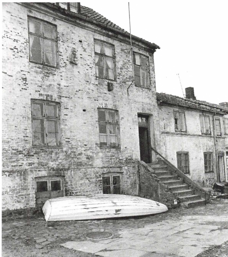
Lappen nr. 22-24 set fra bagsiden i 1971.