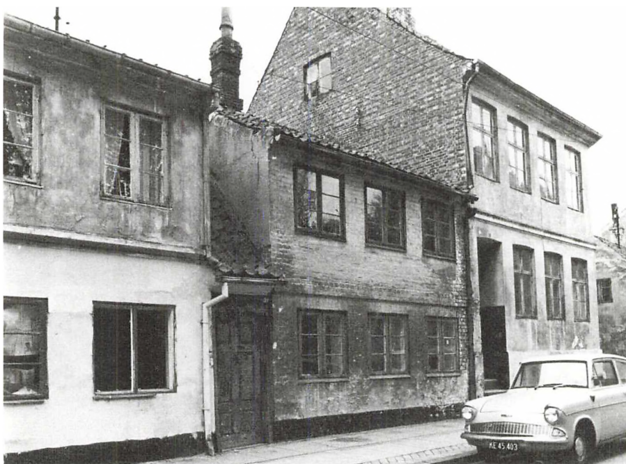
Lappen nr. 24 før saneringen.