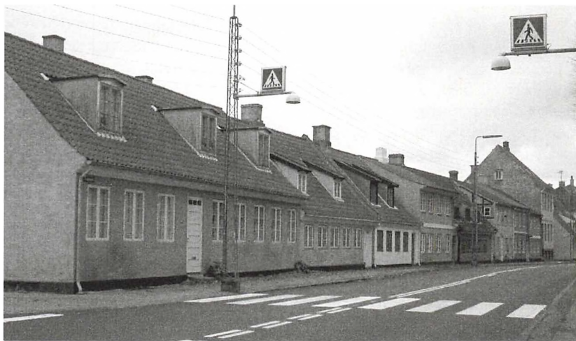
Husene på Lappen som de ser ud i dag.

Artiklen har tidligere været offentliggjort i Helsingør Kommunes Bibliotekers online magasin »Tekst, lyd & billede, 2004, juli-august« http://www.helsbib.dk/tilbud/tekst_lyd_billede/2004/index.asp