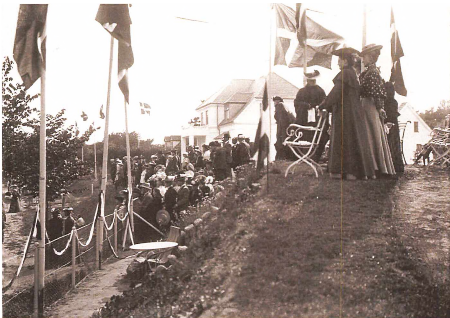
Fredensborg Station 20.7.1906. Fr. VIII og Dr. Louise kommer til Fredensborg for første gang efter tronbestigelsen 29.1.1906.

Fredensborg Slot, bestående af en halv snes 6-personers, 2-spands ekvipager. Landauerne transporterede de fornemme gæster fra stationen til Fredensborg Slot, mens honoratiorene og nysgerrige turister stimlede sammen for at få et glimt af de kronede hoveder, når de gik fra kongeventesalen ud til vognene. De fleste sommerferiebesøg lå mellem den 1. juni og 15. september. Højdepunktet af »Fredensborg-dagene« var imellem 1876 og 1893, selv om de første kongelige besøg startede 1864 og varede i næsten 40 år.