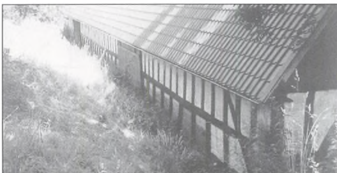
Ladens nordvæg. Bemærk det unike bindingsværk. Øverst murede tavler, nederst bulfjæle.