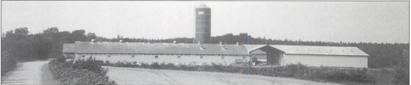
Sneverholt set fra syd sommeren 2002.