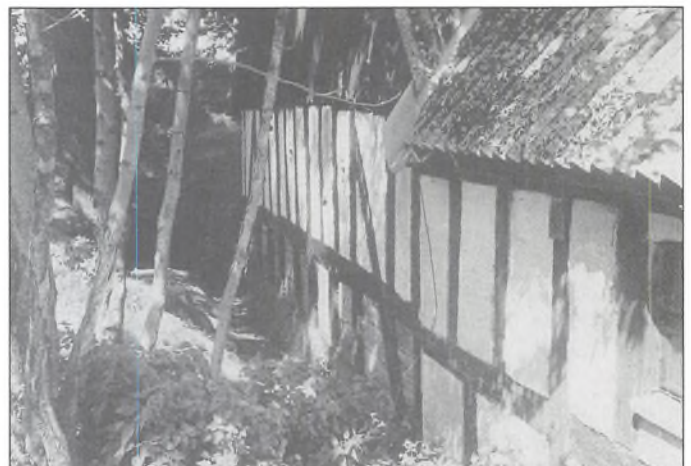
Fodremmen er lagt på Flensborgsten. I bindingsværkets nederste del er tavlene fyldt ud med bulfjæle, hvorimod den øverste del er med murede tavler.

Navnet forvanskes iøvrigt siden, det blev til bolværk.