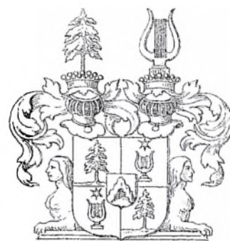
Baron Holbergs våbenskjold.

I 1747 testamenterede Holberg sine ejendomme til Sorø Akademi, og for at holde godserne samlede fik han oprettet "Baroniet Holberg". Samtidig blev han ophøjet til friherrestanden. Men for Sorø Akademi var det svært at vente på, at baronen skulle dø, så et par år senere fik akademiet alle baroniets årlige indtægter. Til gengæld fik Holberg ret til fri begravelse inde i Sorø Kirke, når han engang døde. Og i Sorø Kirkes kapel ved nordre korsarm hviler Holberg den dag i dag i en stor sarkofag, der er tegnet af Wiedewelt. Sarkofagen står bag et jerngitter, der er smykket med en nitakket grevekroner, selv om baroner strengt taget kun har ret til en syvtakket krone. Holbergs død blev omtalt i den daværende Berlingske Tidende den 28. januar 1754: "Udi sidst afvigte nat klokken 1 slet blev vor store og udødelige hr. baron Ludvig Holberg, efter en langvarig svaghed, ved den timelige død i hans alders 70. år, til ubodelig forlis for videnskaberne, bortkaldet fra denne verden."