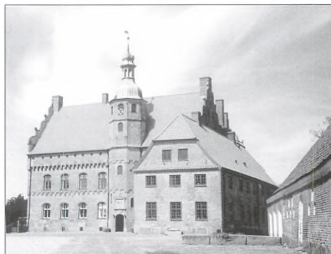
Ørbækklunde set syd. Foran den meget interessante hovedfløjs østfløj fra 1635, der blev ombygget efter brand i 1750.