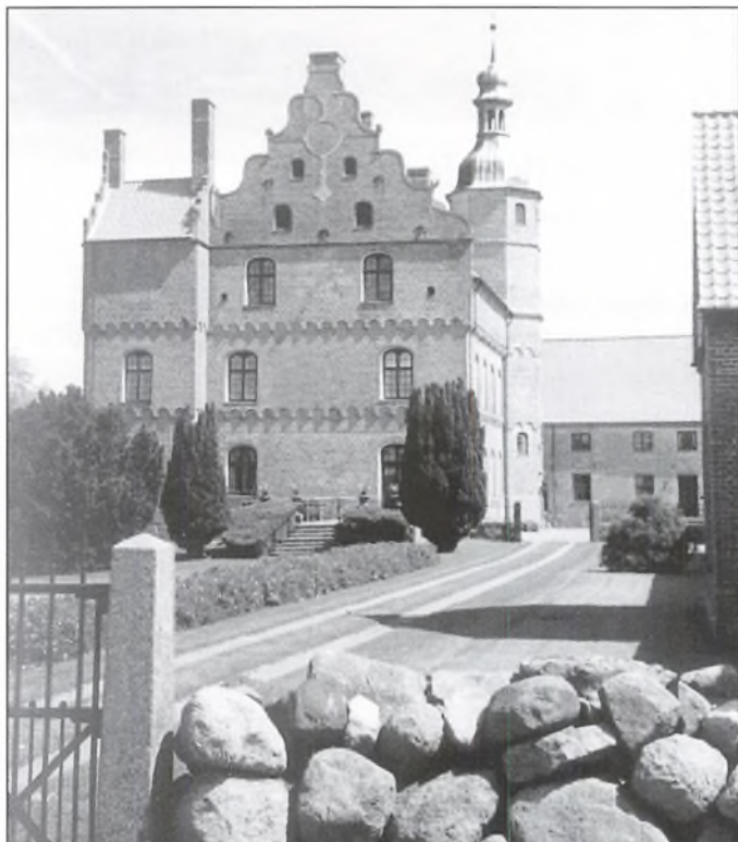
Ørbækklunde set fra vest. Det høje hus fra 1560 med trappetårn og hjørnetårn samt de svungne gavle fra 1593. Ørbækklunde er en af de meget få herreborge fra renæssancen der har bevaret hvælvingerne i hele stueetagen.

På et højedrag udenfor landsbyen Ørbæk på Østfyn ligger Ørbækklunde, et imponerende herresæde fra den tidlige renæssance. Og som en rigtig herreborg er den til at se på lang afstand. Den tids borge skulle dominere landskabet. Borgen skulle vise, at her residerer en stormand.