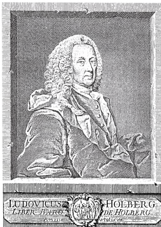
Ludvig Holberg (1684-1754), forfatter, professor og godsejer.