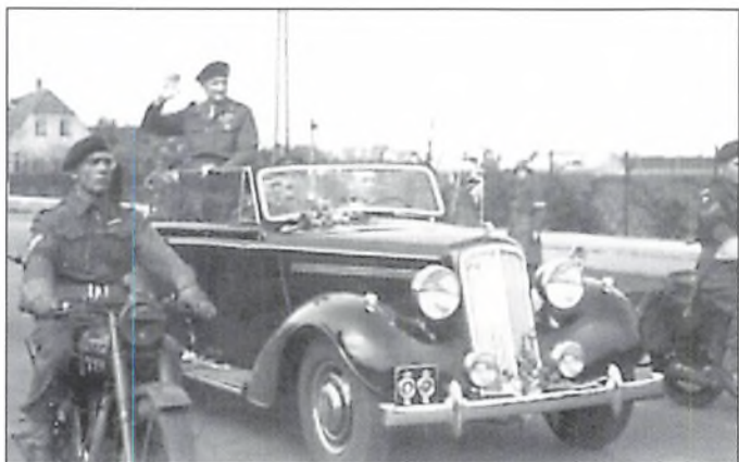
Biludstillingen rummer bl.a. den Humber, som feltmarskal Montgomery kørte i triumftog gennem København efter befrielsen i 1945.