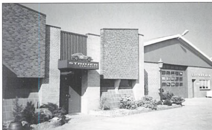
Vedstårup Teglværk er ikke kun mursten, men fabrikskomplekset rummer også Strøjer Samlingen, der er en enestående samling af sports- og luksusbiler i fineste stand.

Foran teglværket står en meget stor krukke, som kunstneren Peter Brandes har lavet. Han er netop kendt for sine enormt