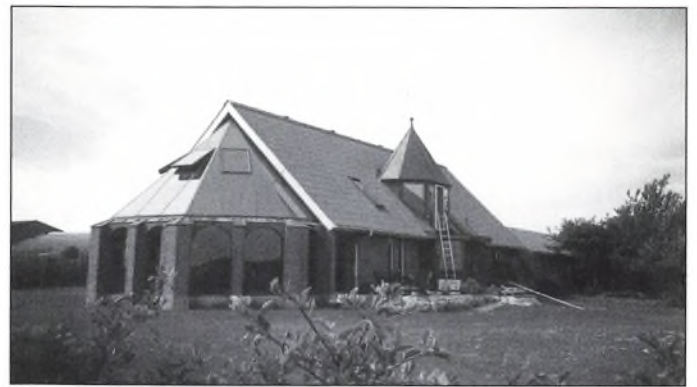
Stuehusets ældste del er fra 1976, og har siden gennemgået flere til- og ombygninger.

Vedersø var dengang en halvø, da fjorden endnu ikke var tørret ud.