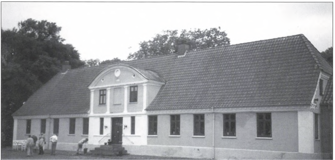
Tandrup's hovedbygning er dateret til 1825, men indtil 1850 var der midt i hovedfløjen en port, som blev afløst af det nuværende indgangsparti med den fladbuede frontispice. På sammetid sløjfedes voldgravene. Det er uraditionelt, at hovedfløjen ligger ud mod gården, og sidefløjene strækker sig bag ud. Det kan tolkes, som den gamle hovedfløj har ligget ud mod haven, og da anlægget skulle fornyes, opførtes den ny fløj ud til gårdspladsen.