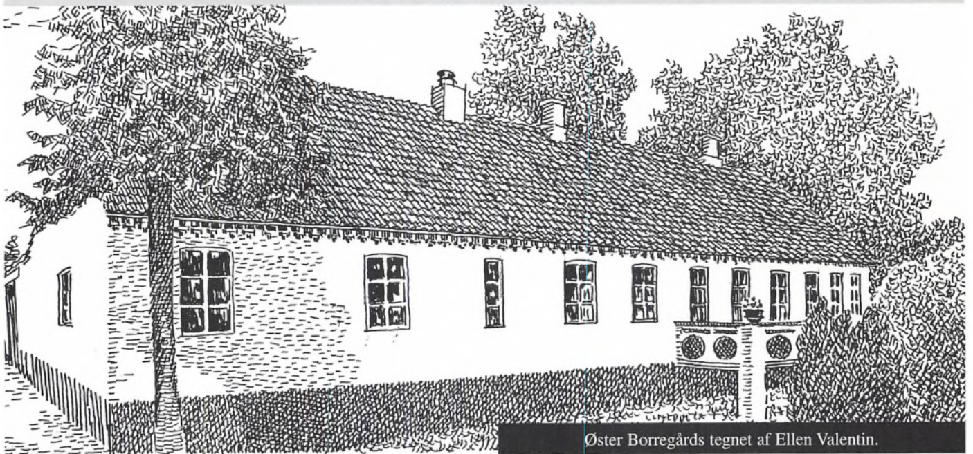
Øster Borregårds tegnet af Ellen Valentin.

Bornholms Tekniske Samling er indrettet i Øster Borregårds bygninger. Og når sommerferien tilbringes på Bornholm, bør man ikke køre forbi dette meget interessante familie- og gårdmuseum. Hvor Museumsgården Melstedgård ved Gudhjem står for det gamle landbrug, så repræsenterer Øster Borregård landbruget i midten af forrige århundrede, den periode som indebar den store forvandling i dansk landbrug.