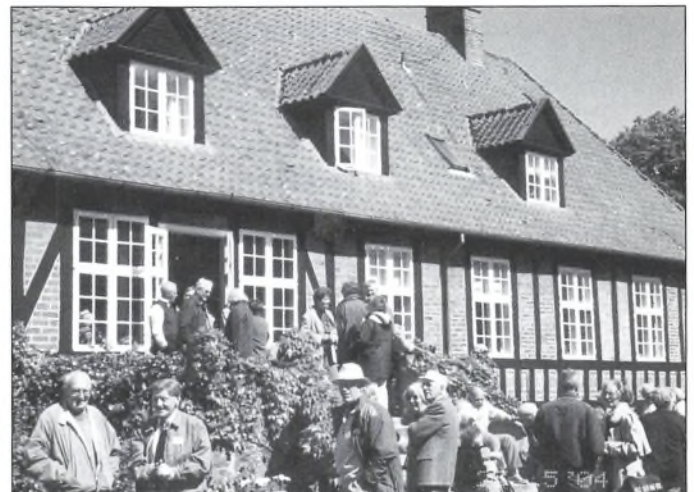
Årsmødedeltagere foran Østergårds hovedbygning. Besøget blev uforglemmeligt, for vejret var med os, og gæstfriheden meget stor.