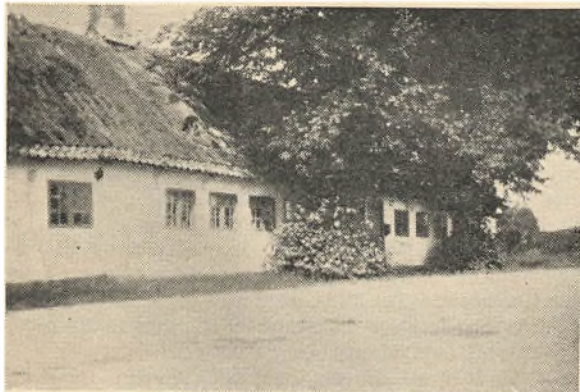
Tuse gamle Kro ved Landevejen fra Holbæk til Kalundborg, nu nedlagt som Kro. — Her holdtes, indtil Aarhundredskiftet, hvert Efteraar et stort Gaasemarked.

tes efter Græsning eller Høslet. Helt ufrugtbare Jorder takseredes ikke. Møller, Tiender, Fiskerifgifter m. m. blev opført ved gammelt Hartkorn. For Møllernes Vedkommende blev Skylden dog færdigreguleret efter Matriklens Afslutning, og Resultatet findes i den saakaldte Møllebog. Det er klart, at alle disse mange Opmaalinger og Takseringer maatte afkaste en Mængde Protokoller med Arbejdsresultaterne. Opmaalingsprotokollerne og de af dem ekstraherede Ekstrakt-opmaalingsprotokoller kaldes med en fælles Betegnelse for Markbøger, der findes med en Protokol for hvert Sogn. Desuden findes for de allerfleste Herreder en Skov-, Eng- og Græsningstaksationsprotokol, der indeholder Hartkornsansættelsen for de Fællesjorder, som ikke var under Kultur.