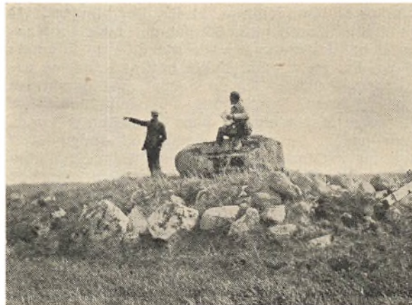
Kæmpehøj paa Føjlegaards Mark

Gaarden har et Areal paa 62 Tdr. Land med Hartkorn 7 Td. 2 Skp. 1 Fdk. ½ Alb. Jorden blev dyrket som almindeligt Landbrug med Kornavl, lidt Frøavl, Kvægavl, Svineavl og Hestetillæg. 9 Skifter var det almindelige. Et dejligt Stykke Jord er det at arbejde med, der er Muldrag og tildels Lerunderlag. Nu er den grundforbedret ved Dræning. En almindelig Markvej fører ud i Marken forbi en Gravhøj og 2 Stendysser, 1 Stendysse ligger længere hene paa Marken — alle disse Oldtidsminder er fredede. Der er Beplantning af Gran og Buskads paa Dysserne og Højen, der kaldes „Dilhøj“. En prægtig Udsigt er der fra Højen. Man ser mange Kirker — deriblandt Roskilde Domkirke. Roskilde