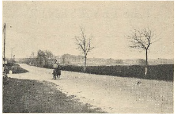
Parti fra en af Fyns skønne Egne — Vissenbjerg — midt mellem Odense og Middelfart

Herremanden brugte ofte Bonden, hans Familie og Tjenestefolk til alt muligt Arbejde. Hvis han ombyggede sin Herregaard eller opførte en ny, maatte Bonden køre Tømmer, Grus og Sten dertil og gaa Haandværkerne til Haande. Han maatte sørge for Renholdelsen af Herregaardshaven; hans Tjenestepige maatte vaske Vinduer paa Herregaarden. Han maatte klippe Faar, tække Huse, feje Gaard, køre Tørv hjem, bære Aske ud, tærske, hegne Hovmarken, rydde Sten, fælde Træer, save Brænde og grave Grøfter, ja, Fæstebonden var sunket ned til at være Herremandens Tyende.