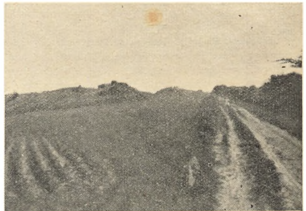
Hulvejene ved Drastrup paa Djursland.

Tæt Vest for Farum By i Nordsjælland findes en Jættestue, og to Dysser har der været lige ved. Paa begge Sider af Jættestuen løber Vejspor ned mod Engen ved Farum Sø's Vestende, og man kan regne ud, at Overgangen her maa have haft en Mellemstation paa den lille Dronningholm midt i Engen, men dennes Overflade er én eneste stor Boplad fra yngre Stenalder, samme Tid som Jættestuen og Dysserne. Fortsætter vi nu over til den sydlige Engkant, møder vi her en Vifte af ikke mindre end 10 Hulveje op over Skrænten i Farum Kirkeskov, og som parallelle Vejspor kan de følges en halv Kilometer sydpaa; imellem Sporene træffer vi først her en Runddysse, senere en Langdysse, og den førstnævnte ligger endda ved et Vejspor, som øjensynlig kun fører til den, og daarligt kan udtydes som andet end den Vej, ad hvilken Dyssens Sten oprindelig er slæbt til Stedet. Selv om selve de forhaandenværende Hulveje ikke med fuldkommen Sikkerhed kan dateres til Stenalderen, saa viser dog Oldtidsmindernes Anbringelse ved Vadestedet, at dette har været kendt og anvendt allerede da. Paa den anden