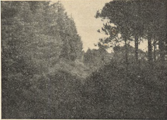
Hulvej gennem Legindbjerge paa Mors ved Sallingsund.