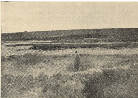
Von Kahlens Brønd ved Kongenshus 1949.