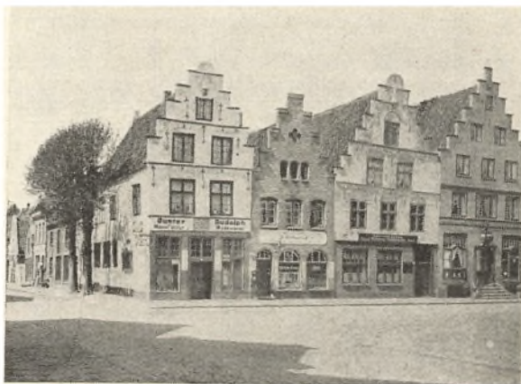
Torvet i Frederiksstad.

Vi tager så herfra til den smukke, gamle slægtsgård Hohnhof, som har været i slægten Ohems eje i 500 år, og derfra til Rendsborg.