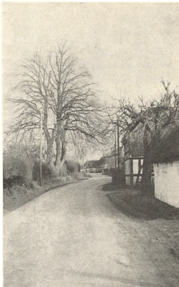
Træer præger her afgørende vejbilledet.

D EN, SOM HAR haft lejlighed til at iagttage nordmændenes omgang med gårdenes tuntræer , vil vide, at kærligheden til og respekten for træer fremdeles er dybt rodfæstet i sindene i fjeldverdenen. På Gimle seter sad jeg forleden år og hørte med hvilket lune en ældre nordmand fortalte om, hvad der under krigen hændte mellem stammerne i de tætte grænse-skove, som skiller Norge og Sverige. Her færdedes undergrundsfolk og flygtninge hjemmenvant ad vekslerne i udmarken. Her rystede tænderne løse i tyskernes gebisser — af skræk for mer' end Pan, for der fandtes rent ud sagt forbandede overraskelser parat, om de blev for kålhøgne på flygtningejagten eller for nidkære. Håkon Lie taler om træerne med samme varme som Johannes V. Jensen, men ikke med så udtalt et sprogligt mesterskab. Mindre kan også gøre det, hvor talen først og fremmest er om sindet for træer , og hvad Lie's angår kan der ingen tvivl herske. Han taler om træerne, der blev vidne til den epokegørende handling, det var, da et menneske første gang bukkede sig, greb en sten og slængte den efter en flygtende fugl og nedlagde den. Han kalder det en planmæssig handling, født af den ubevidste bevægelse, hvormed han før kastede en uspiselig frugt fra sig i træerne. Den dag blev hankønnet mand , beundret derfor af kvinder og unger. Den be-