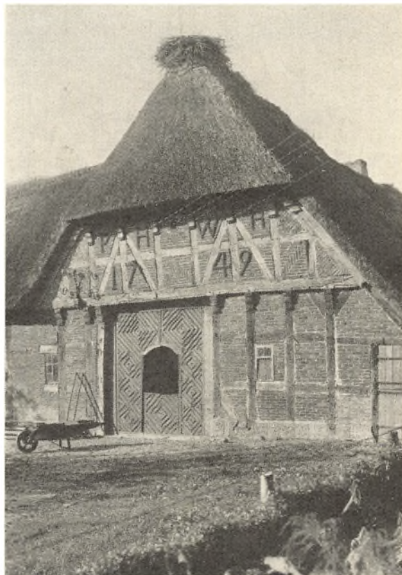
Gård i Sæd ved Frederiksstad.