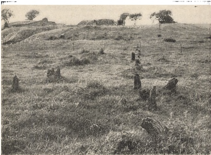
Næsholm-Ruinen, som den ser ud i Dag.

deres Afdøde her, længe før Menneskene blev saa udviklede i Krigskunst, at de kunde bygge Borge. Naar alt dette intet siger, faar vel de Kloge nøjes med at holde sig til de føromtaltte Mønter, og Sagnet holder jo med dem: Kong Valdemar Atterdag var den, der byggede og boede her. Og han har holdt af Stedet. Længe, længe efter sin Død færdes hans Skygge endnu her omkring, til Hest, sammen med et Følge af hans bedste Mænd.