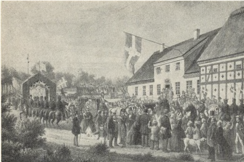
Ved Gribsvad Kro 1861. (Litografi af N. F. Niss, Teatermuseet)

væsenselev på Erholm avlsgård. Efter at have af-tjent sin værnepligt, blev han ansat ved politiet i København, og derefter blev han statsbetjent med kriminelle opgaver i Odense amt og boede i den tidligere skovriderbolig ved skoven Hegnetslund mellem Erholm og Gribsvad. Derefter blev politimanden, hvorefter man sagde, at han med sit skarpe røntgenblik kunne se, om folk havde en god eller dårlig samvittighed, ansat ved grænse-kriminalpolitiet i Kruså, og senere blev Himmelstrup politikommissær i København og behandlede især sager i provinsen.