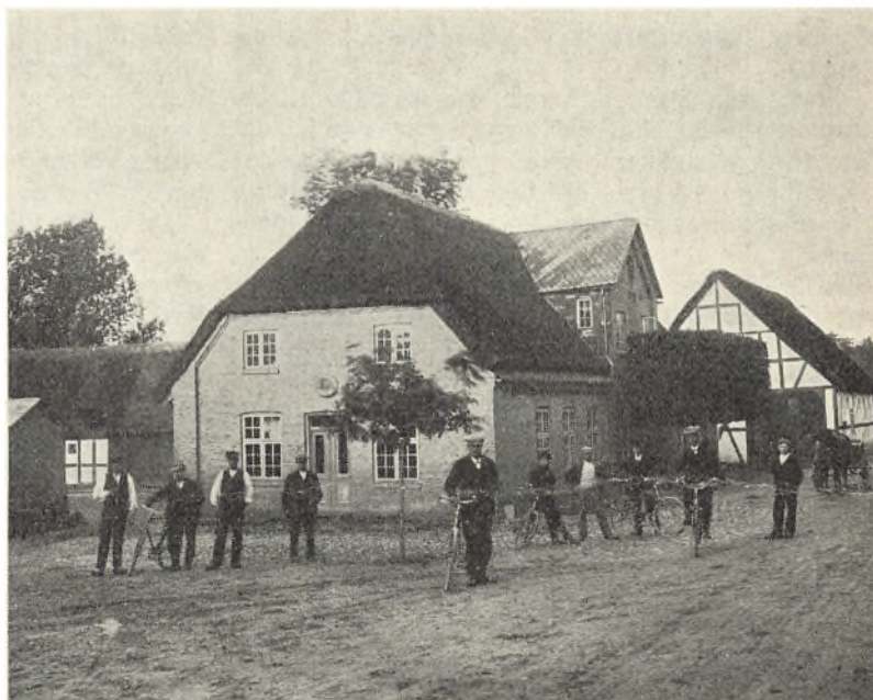
Gribsvad Kro før branden 1910. Kroskiltet sidder over indgangsdøren i gavlen.