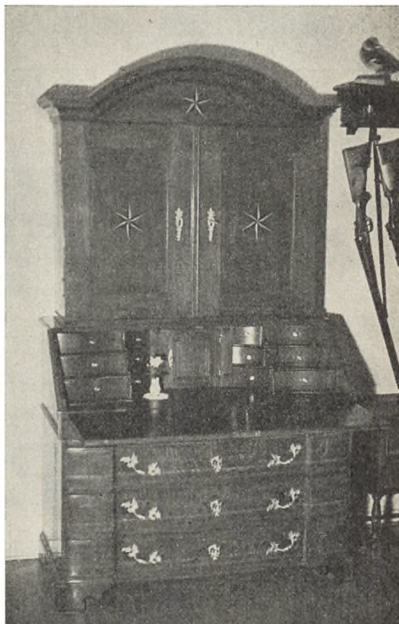
Chatol med skænk (Vestfyn) fra sidste halvdel af 1700-årene (tilsvarende på Koldinghus Museum), pommersk eg med indlagte buksbomstjerner.

Standkisterne hører til de ældste bondemøbler, man kan træffe kister, hvis alder rækker 200 år tilbage og mere. Om chatoller kan det vist almindeligvis siges, at den flade klap er ældre end den runde. Chatollerne blev almindelige i sidste halvdel af 1700erne.