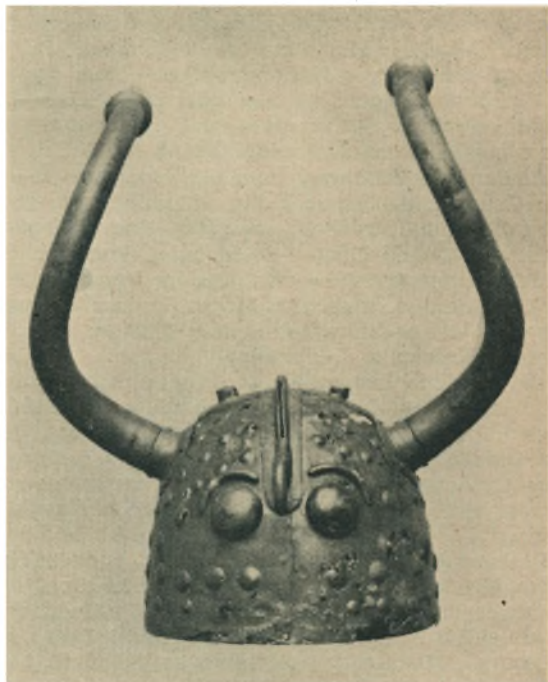
Fig. 2. Den ene af Bronzehjelmene fra Viksø.

Ogsaa Oldsager fra Jernalderen har Tørvegrav-