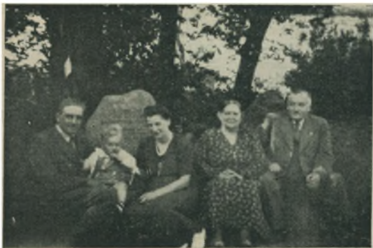
Tre Generationer. Fra Slægtsfesten paa Elmegaard i Vejleby. (Se Artiklen i forrige Numer.)

ningen bragt for Dagens Lys. Det drejer sig om adskillige Redskaber og Vaaben, de fleste Enkeltfund — saaledes et prægtigt Vikingesværd fra Randers-egnen, nu i Randers Museum — og ikke saa faa Smykker, de fleste af Guld, ogsaa fortrinsvis fundet enkeltvis. Dertil kommer flere Votivfund, hvoraf maa nævnes et fra en Mose ved Tranum Klit i Han Herred, bestaaende af en rigt ornamenteret Bøjle-naal af Sølv, et Par Guldfigerringe, nogle Smaa-dele af Sølv og 93 Glasperler, alt fra Germansk Jernalder, samt de to mærkelige Fund, der er gjort i en lille Mose ved Smederup, nær Odder. I denne Mose fandtes i 1942 en Brønd af Træplanker, med et mægtigt Trækar som en indre Beklædning; i dette Trækar, det største, der kendes fra Danmarks Oldtid — fandtes bl. a. 14-15 Lerkar. Aaret efter fremdroges et stort Antal Bronzeringe, af forskellig Form og Størrelse, over 300 Stykker, det største Fund i sin Art her i Landet. Begge Fund, der findes paa Nationalmuseet — idet dog en Del af Bronzeringene er deponeret paa Odder Museum — repræsenterer utvivlsomt Offerneklæggelser i keltisk Jernalders ældre Del, 3-400 f. Kr.