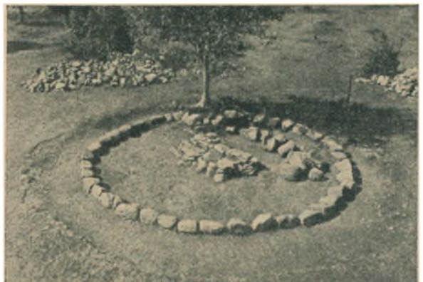
En af de store Røser efter Udgravning; midt i den ses selve Kisten, til højre for den ligger et Par Kornkværne.

Hvorledes vore Forfædre i Oldtiden levede, hvorledes de drev deres Landbrug, byggede deres Huse, tilbragte deres Fest- og Arbejdsaar og forestillede sig Døden og det Hindsidige, alt det ved vi efterhaanden temmelig god Besked med, men altid har vi her i Landet kun set det brudstykkevis, her en Hustomt, der nogle Grave, et tredje Sted et Markomraade, aldrig en hel Landsby; det var derfor ikke blot for at faa Besked om Sveriges Oldtid, men lige saa meget for at lære nyt om vores egen, at vi fra dansk Side i Aarene 1946-48 tog imod en Indbydelse til at deltage i store Udgravninger paa Gotland, hvor man havde fundet en hel Landsby med Gaarde, Marker, Gaardspladser og Veje liggende forladt og urørt i halvandet Aartusinde, siden den ca. 500 Aar e. Kr. F. blev hærget og brændt i en nu glemte Krig mellem Gotland og det svenske Fastland. Og her oprullede sig da for os det Helhedsbillede, vi savnede: I Løbet af 3 Somre undersøgte vi 25 Husruiner, over 100