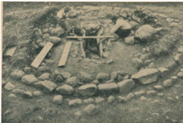
Gravkiste under Udgravning.