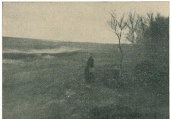
Stordalen ved Kongenshus. 1949.