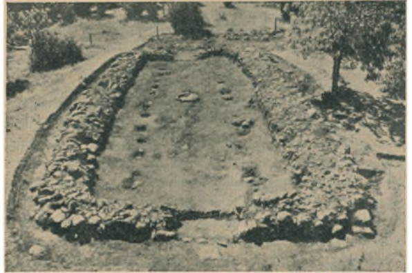
Hustomt under Udgravningen. I Midten Arnen, til Siderne Spor efter de 2 Rækker Stolper inde i Rummet, som har baaret Taget.