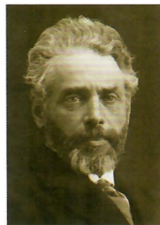
Henrik Pontoppidan, 1903

I erindringsbog "Under vejs til mig selv"; fortæller han om, hvorledes han 6 år gammel og netop flyttet til Randers fra præstegårdens vindue iagttog byen: "Her fra mit Vindu lærte jeg efterhaanden baade Byens Liv og adskillige af dens Beboere at kende. Det stærkeste Indtryk paa mig gjorde dog nogle sære Pjalteskikkelser, der i Ny og Næ dukkede op i Gaden med en snavset Blikspand i Haanden og kiggede sig omkring alle vegne. Det,