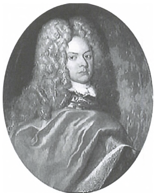
Carl Adolf von Plessen

marks største slavehandel, men han kunne hverken, se høre eller lugte hvad der foregik på hans skibe.