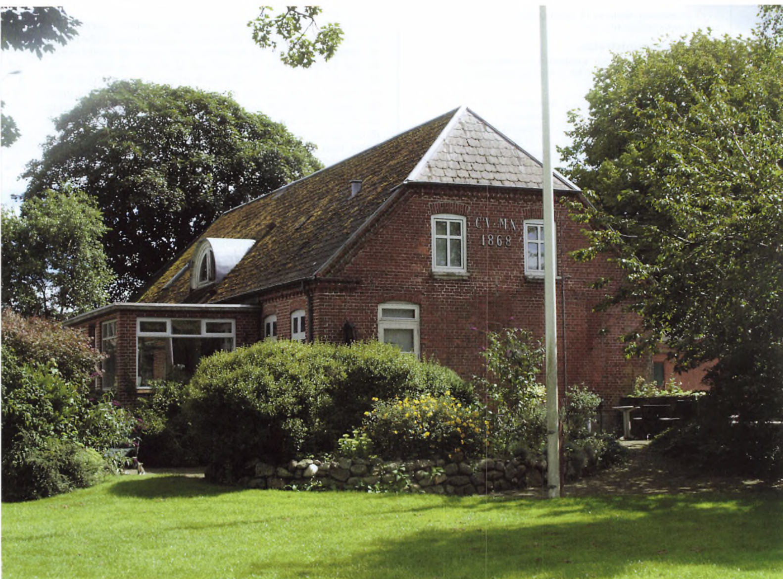
Vordegård, som besøges i forbindelse med årsmødet.