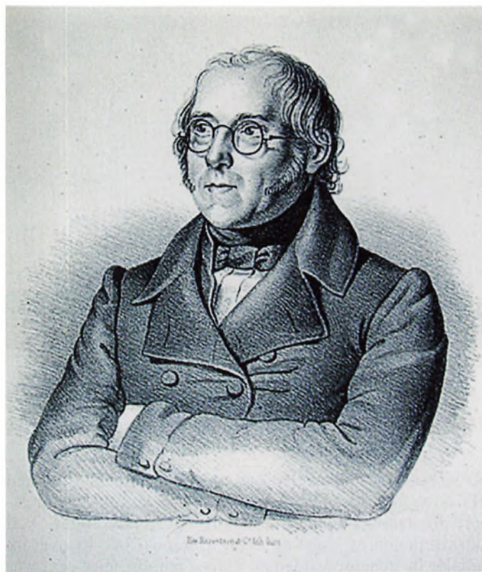
Digteren Steen Steensen Blicher 1782-1848.

Morgengudstjenesten er henlagt til St. St. Blichers kirke i Thorning, og senere på dagen besøger vi herregården Aunsbjerg, der var i en af hans slægtninges besiddelse, og som er rammen om flere af hans fortællinger.