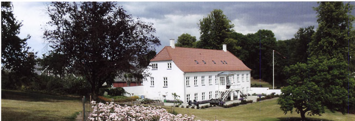
Hovedbygning set fra haven.

Den 7. juni indbyder Vestsjællandskredsen til sommerudflugt, som bl. a. omfatter besøg på Kruusesminde.