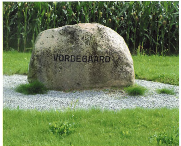
Ved vejen der fører ind til Vordegaard står en smuk sten med gårdens navn.

De sidste 10 år har frisen været så nedbrudt, at den var svær at se. Frisen er dyr at vedligeholde på gammeldags