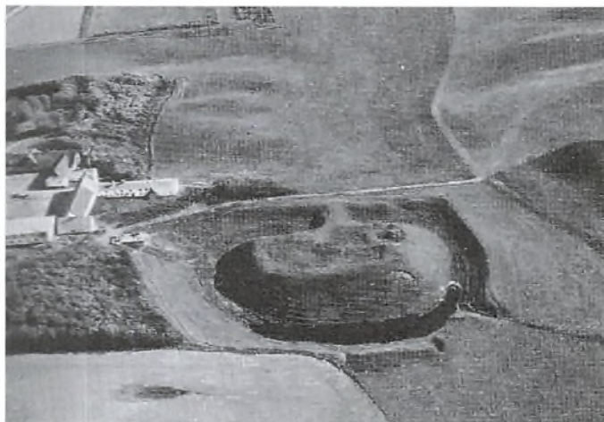
Ældre billede af Asdal voldsted med gården t.v. i billedet.