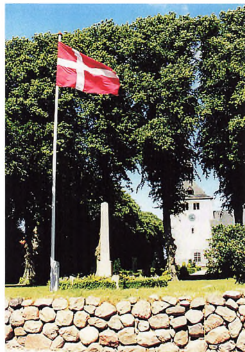
Mindestenen på Lysabild Kirkegård, soklen og en af de 4 sider med navne.

Mere end 30.000 mænd fra Sønderjylland deltog i krigen som tyske soldater, over 5.000 kom ikke hjem igen. De faldt i kamp, døde af deres sår eller af sygdom og krigens strabadser på et lazaret langt borte, eller de blev meldt savnet og aldrig fundet - og blev senere erklæret døde ved dom. De efterlod forældre, kone og børn, brødre og søstre, andre slægtninge, måske en kæreste. Mange af dem, der kom hjem, havde været såret, var måske invalide - eller havde haft voldsomme oplevelser, der gav dem psykiske problemer. Nogle havde været i fangenskab i Frankrig, England eller Rusland og kom først hjem længe efter krigen var slut.