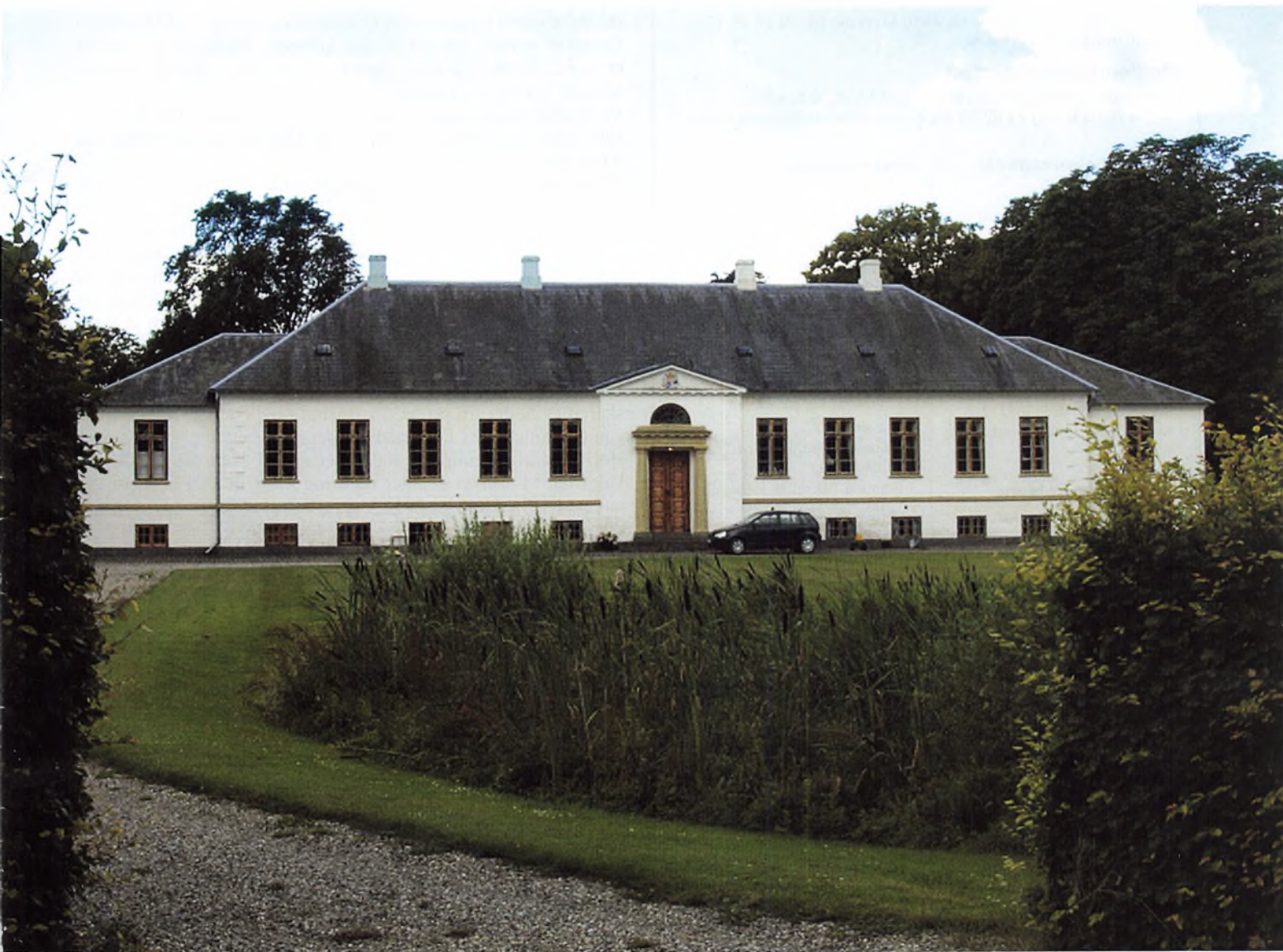
Agerup på Lolland