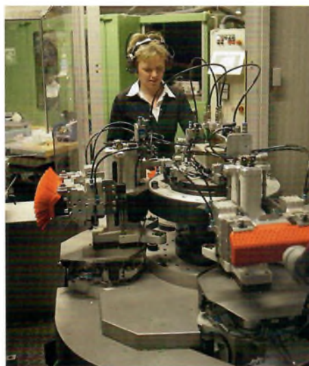
Vikan A/S i Skive