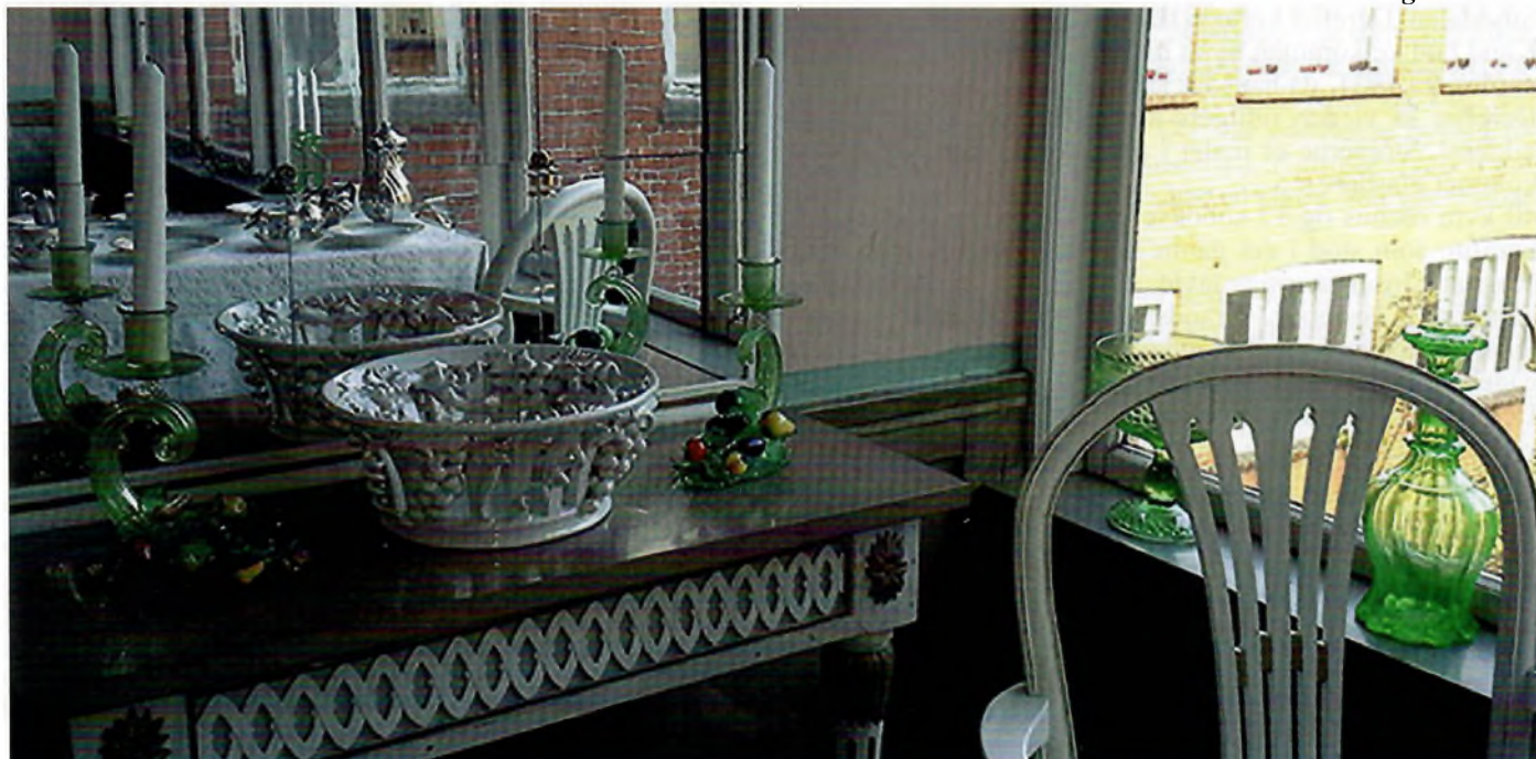
Ernsts Samlinger i Assens