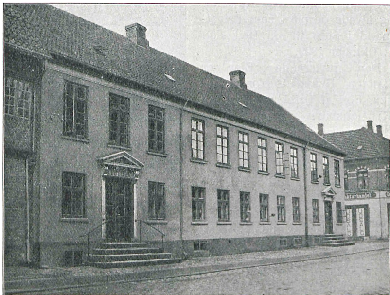
Sorø Apotek 1906.

Gennem 300 Aar har der nu været og ikke været Apotek i Sorø; Sygdom og Trang til Helbredelse har uafslædig hersket i Staden, men ikke altid har Byens Folk haft let Adgang til Lægemidler. De første Farmaceuter, der mente at finde Livets Ophold ved at forsyne Land og By med Læge-dom, fandt ikke Lykken, de