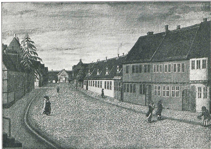
Realgade i Sorø mod Nord 1760—90. (Efter Maleri paa Sorø Akademi.)