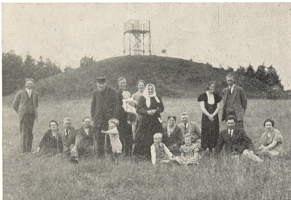
Familien forsamlet foran St. Tørrehøj. 1934.