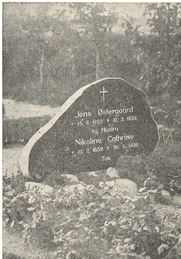
Gravsten, hentet fra Hjemmets Mark. 1940.

Mest var det nok Fader, der gik foran i Ord og Gerning, men du stod trofast bag ved. Nu er vi ogsaa ved at blive gamle. Men jo ældre vi bliver, desto klarere staar det for os, hvad du og Fader har betydet for os. Ved din Baare, inden du for sidste Gang forlader dette Hjem, skal lyde en Tak for, hvad du har været for os. Tak, kære Moder.“