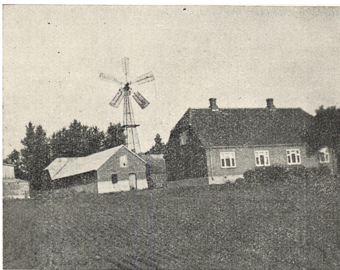
Hjemmet efter Ombygningen, udført 1933 - 34.

Fader og Moder var da henholdsvis 78 og 76 Aar gamle. Dette Aar blev det nye Stuehus opført, og Udhusene var under Ombygning.