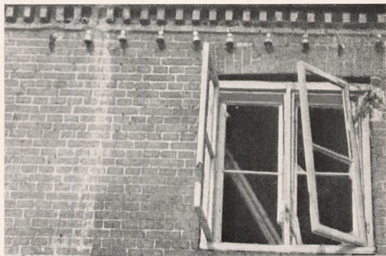
Øverst Administrationsbygningen paa Larsens Plads med 10 Træffere fra Kanonbaaden. Forneden et Billede af det midterste Vindue taget Dagen efter Bombardementet. Foruden en Træffer i Vinduets ene Hjørne har en Granat revet Tagkægget op.