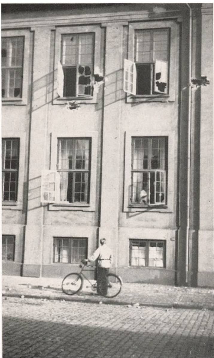
Amaliegade Nr. 42 efter Bombardementet med 37 mm Pansergranat. Særligt tydelige Træffere ses i 1. Sals Højde.