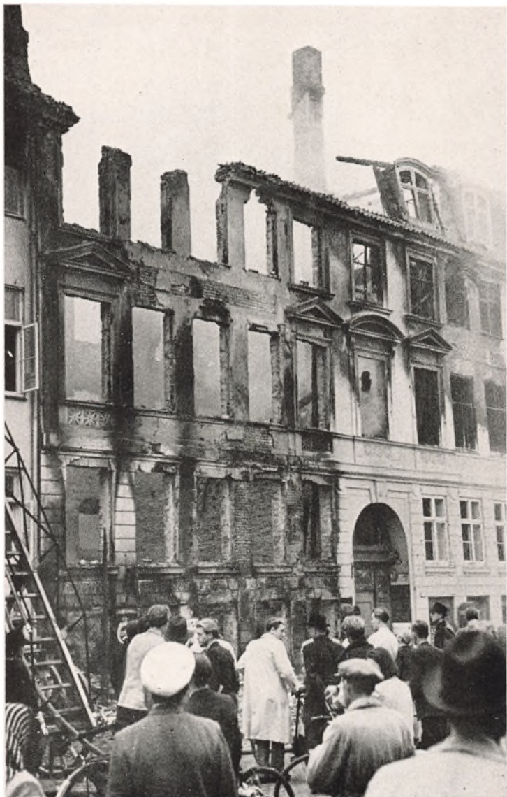
Amaliegade 39, da Brandvæsenet omtrent havde nedkæmpet Ilden.