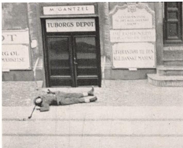
Falden Tysker ved Amaliegade 32.