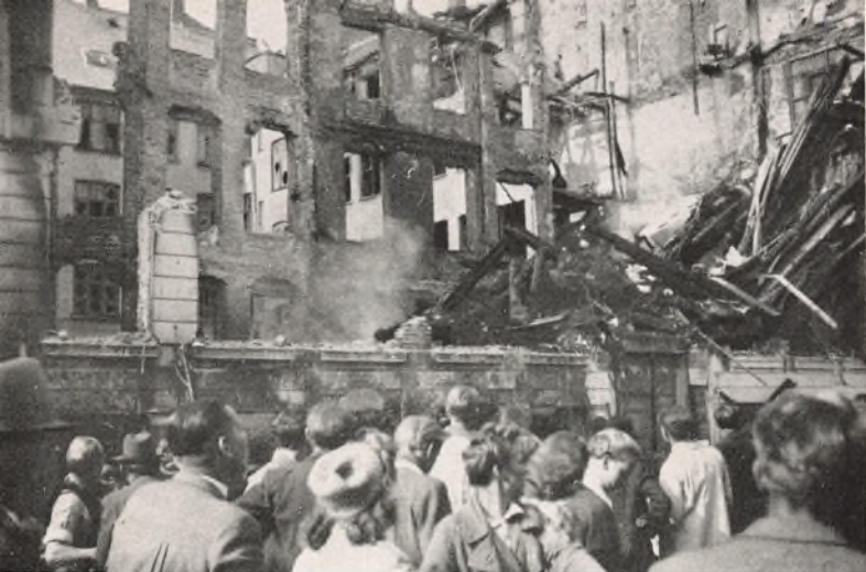
Da Branden i Amaliegade Nr. 39 var slukket, saa Bygningen saaledes ud. Til venstre ses Bagbygningen, hvorfra Beboerne i hele Ejendommen reddede sig ind i Vanførehjemmets Gaard.