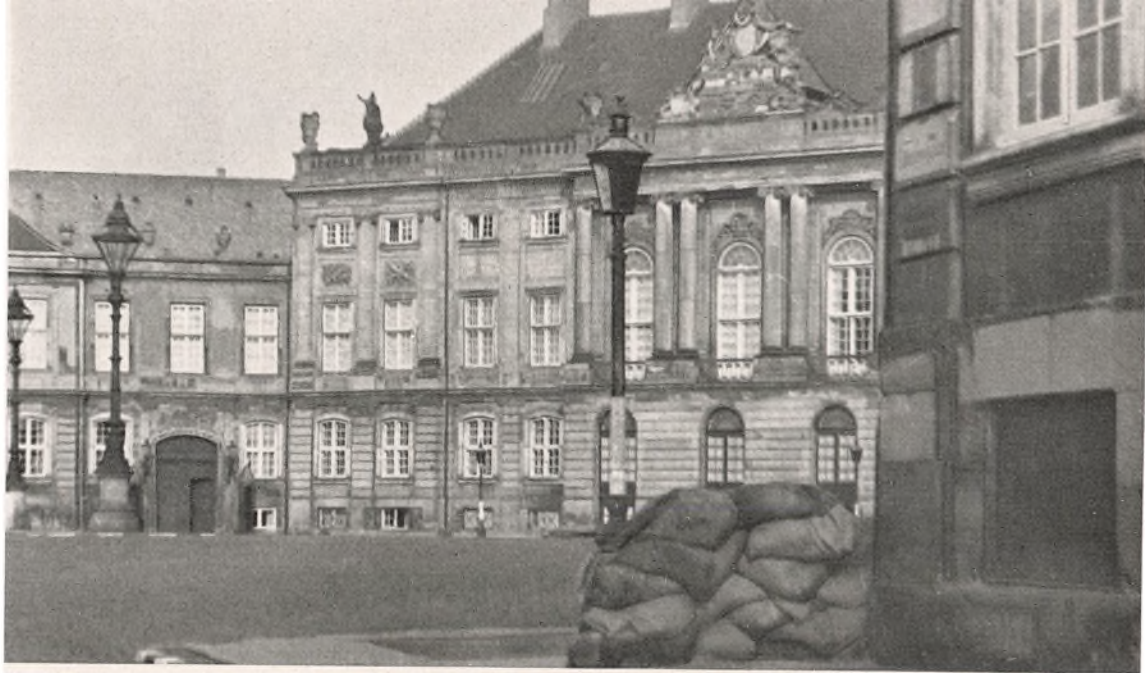
Paa Billedet ses den høje Barrikade paa Hjørnet af Kronprinspalæet ved Frederiksgade—Ny Toldbodgade. I Baggrunden øverst til venstre ses den øverste Del af Damehotellets Gavl (der rager op over Palæets lave Pavillonbygning) med Lufthullerne, hvorfra Barrikaden blev beskydt. Vinduet i Kælderen til højre for Porten sidder i Portnerlogen. Skilderhuset udenfor var lagt ned, og der var fra Vinduet frit Skud ud over Slotspladsen mod Larsen. Pl.