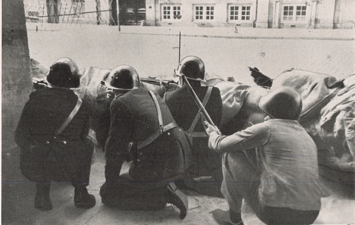
Barrikaden foran Det gule Palæs Port. De første Tyskere viser sig ved St. Annæ Plads, og Politimændene er parate at tage imod dem.