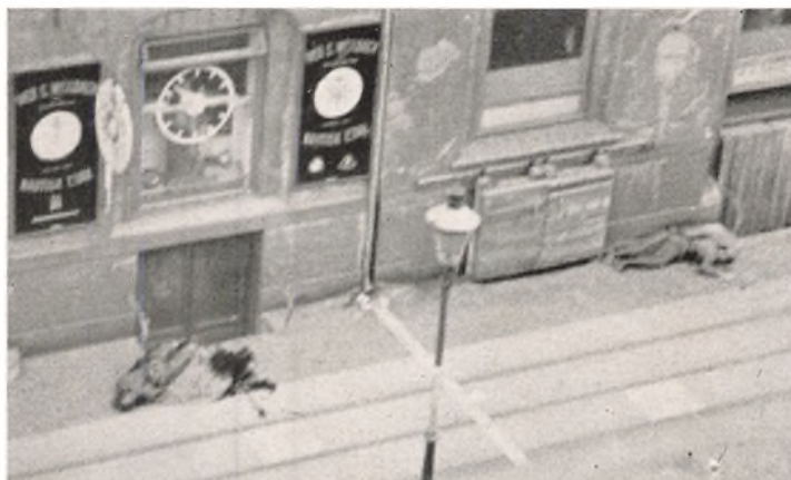
To faldne Tyskere ud for Weilbach & Co.s Kompassforretning, Amaliegade 30. Ved Siden af ham til venstre ses en stor Blodpøl fra en dødelig saaret Tysker, der er hentet af Ambulancen.