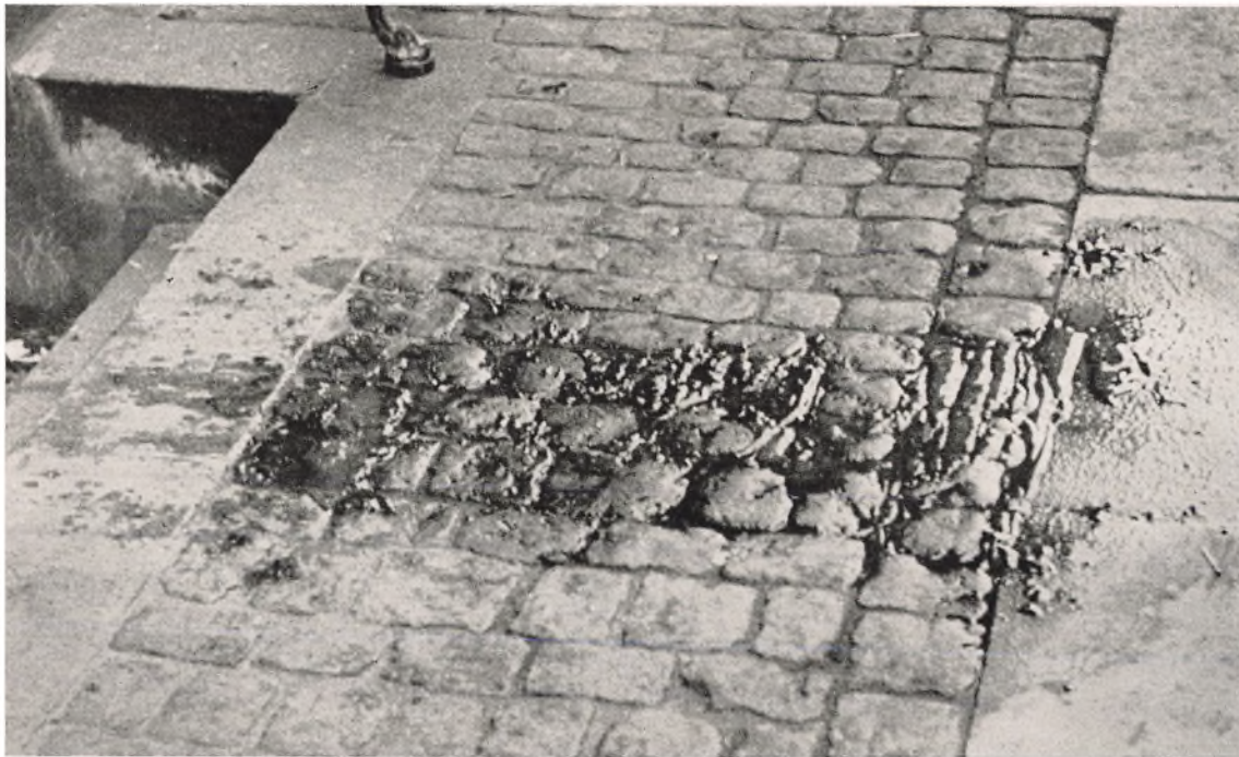
Da en af de faldne Tyskere var fjernet ud for Amaliegade 34, saa Stedet saaledes ud. Der maatte meget Vand til for at skylle „Slagpladsen“ ren.