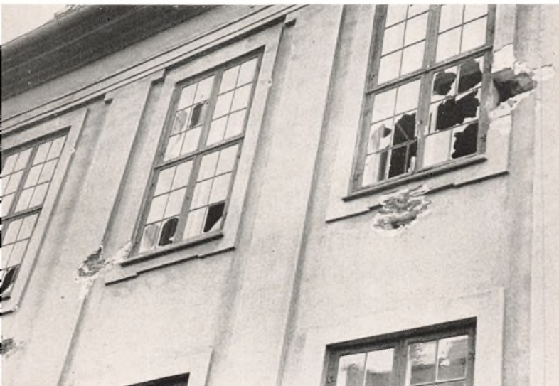
Fire Pansergranaters Spor i Nr. 42. Havde Billedet været skarpere, ville man have kunnet se mange Indslag af Maskinpistol- og Gøveprojektiler