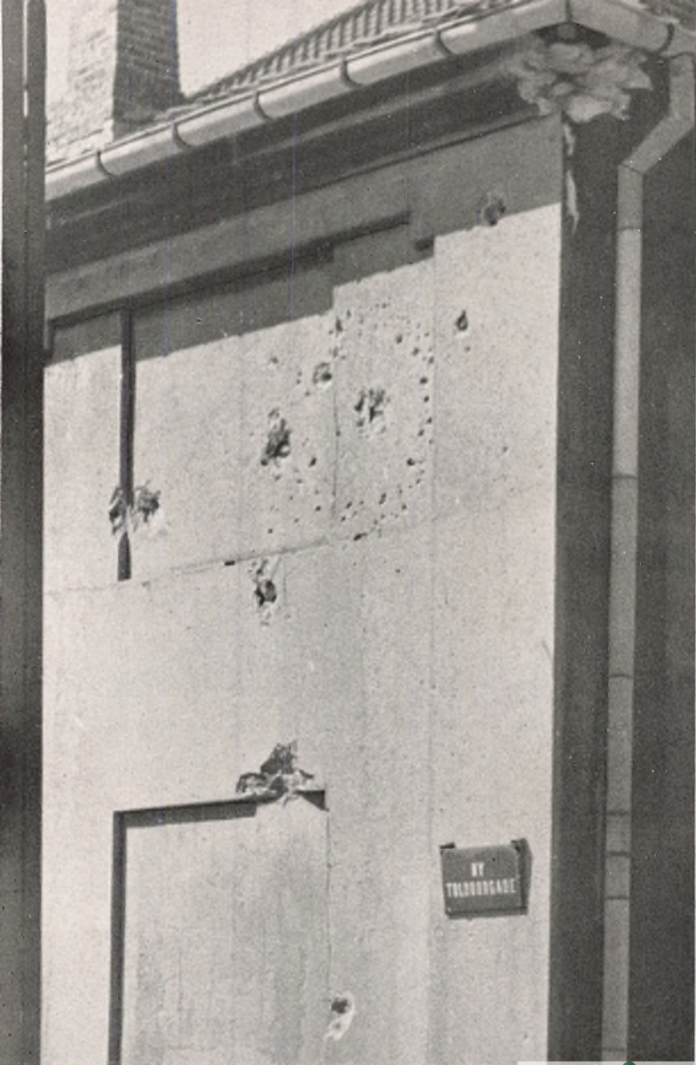
Her er Gavlen mod Ny Tolddodgade med 10 Træffere fra Kanonbøden ved Larsens Plads. De 20 mm Pansergranater har dog ikke lavet store Rødder.