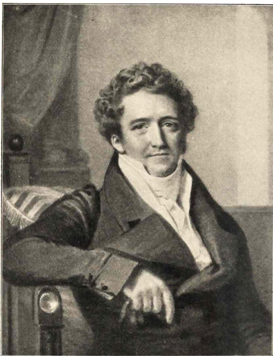
PRINS CHRISTIAN FREDERIK (Christian VIII) Efter Tegning paa Rosenborg (ca. 1830).