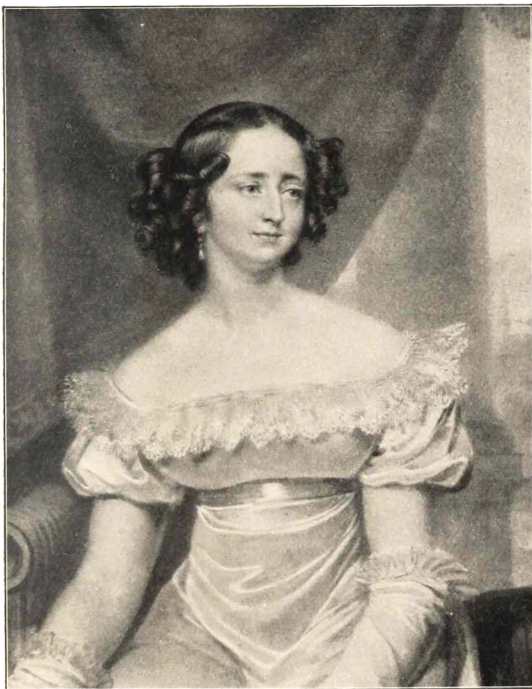
PRINSESSE CAROLINE AMALIE Efter Tegning paa Rosenborg (ca. 1830).