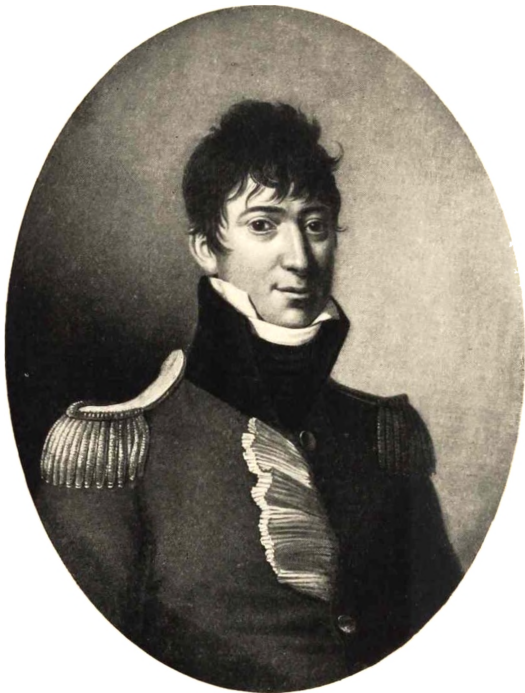
CARL HENRIK HOLTEN Maleri fra ca. 1805.