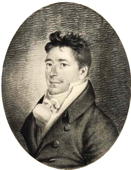
CARL HENRIK HOLTEN Tegning fra ca. 1815.