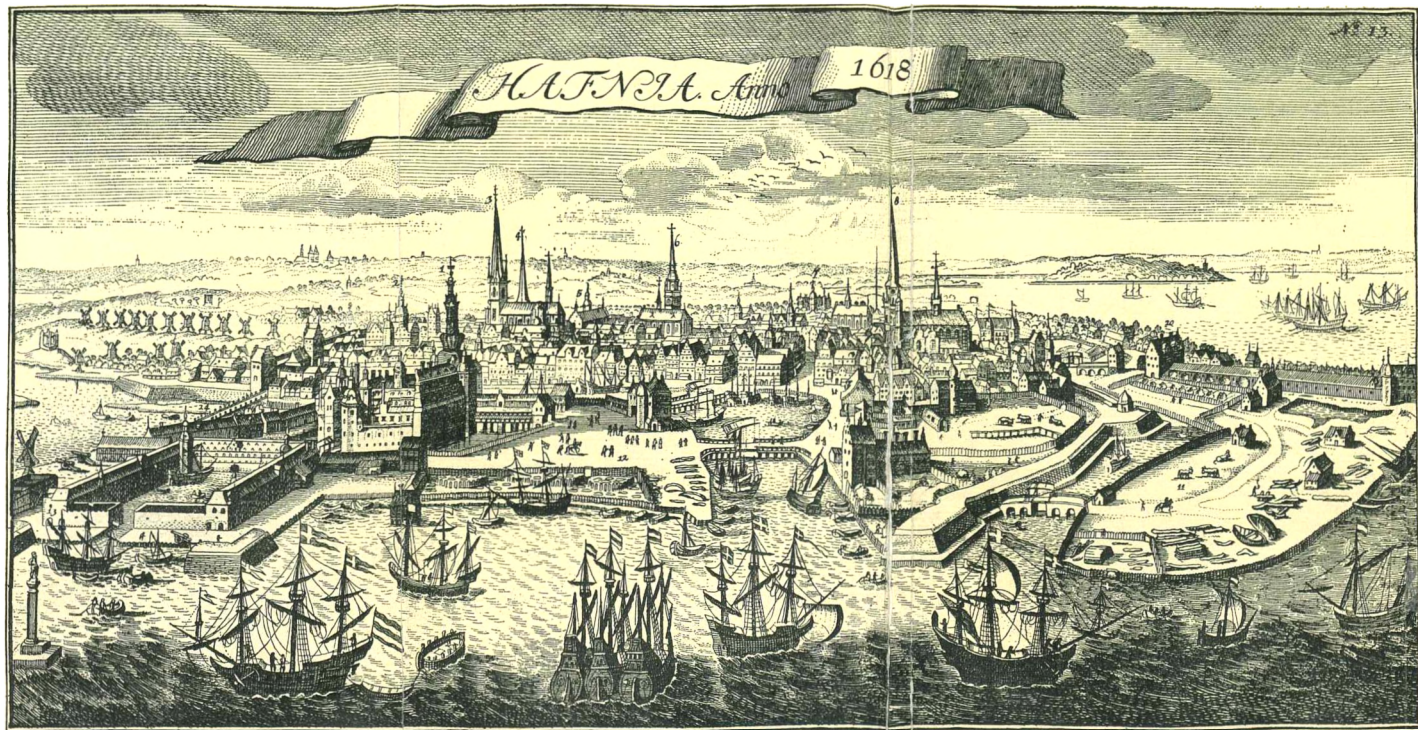
1. Slottet. 2. Raadhuset. 3. W. Frue Kirke. 4. S. Petri K. 5. Universit. 6. H. Gæstes K. 7. Rosenborg. 8. S. Nicol. K. 9. Gam. Ofter Port. 10. Reberbane 11. Bremerholm. 12. Slots-Pladsen. 13. Tøj-Huset. 14. Långangs Broen.