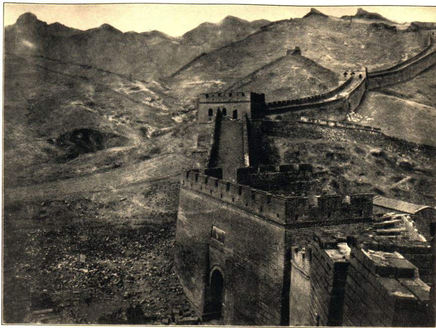
DEN STORE KINESISKE MUR.