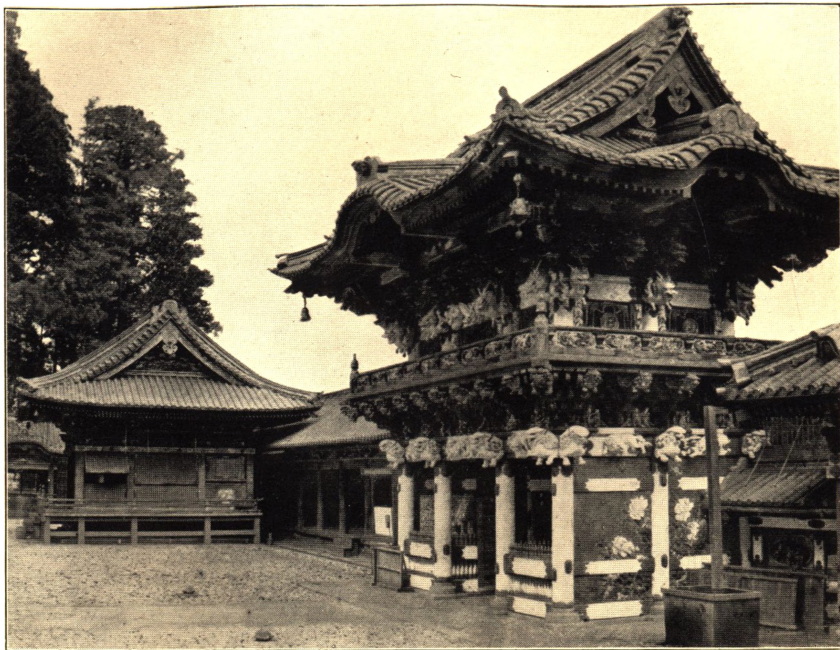
ANDEN FORGAARD TIL IYEFASUS TEMPEL. NIKKO.