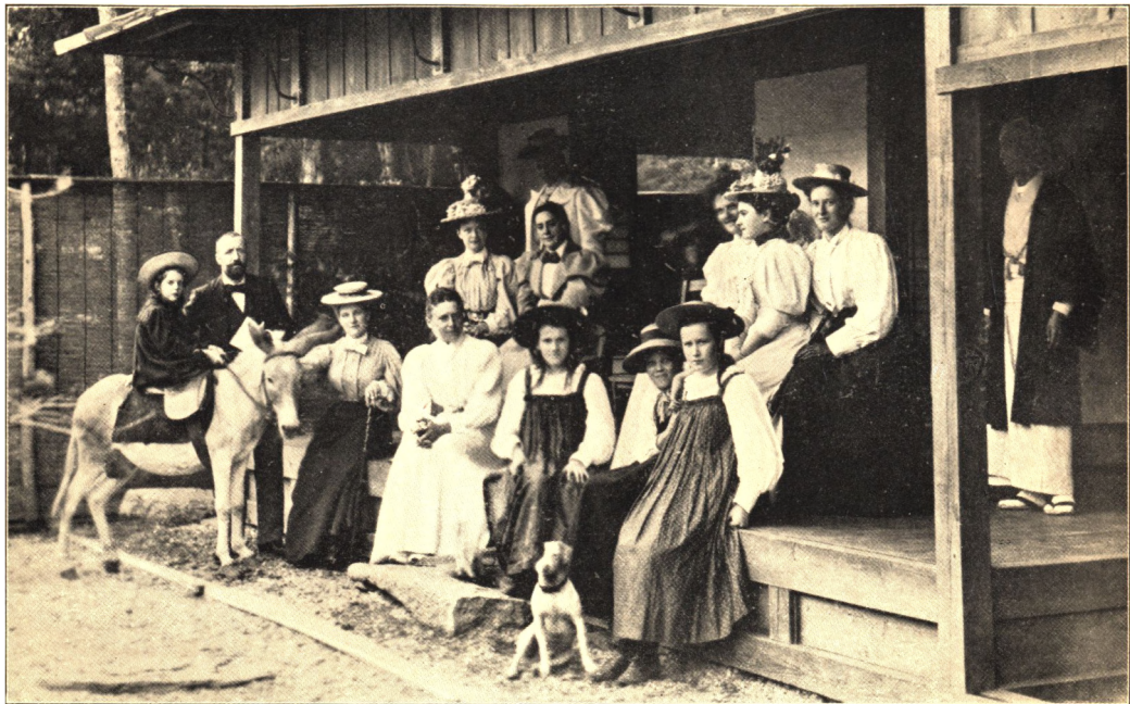
VOR DAGLIGSTUE I CHUSENJI.