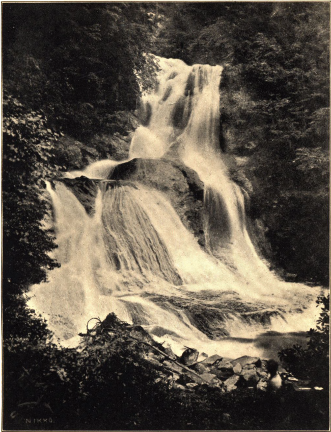
VANDFALDET VED KIRIFUNINOTAKI VED NIKKO.