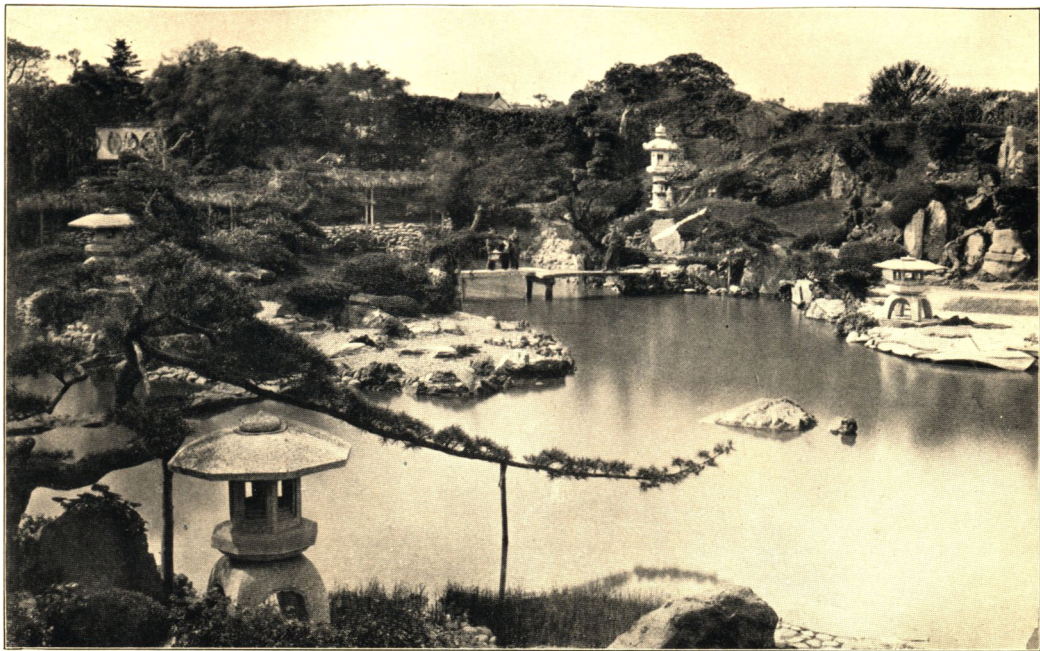
FUKIAGE. EN AF DE KEJSERLIGE HAVER I TOKYO.