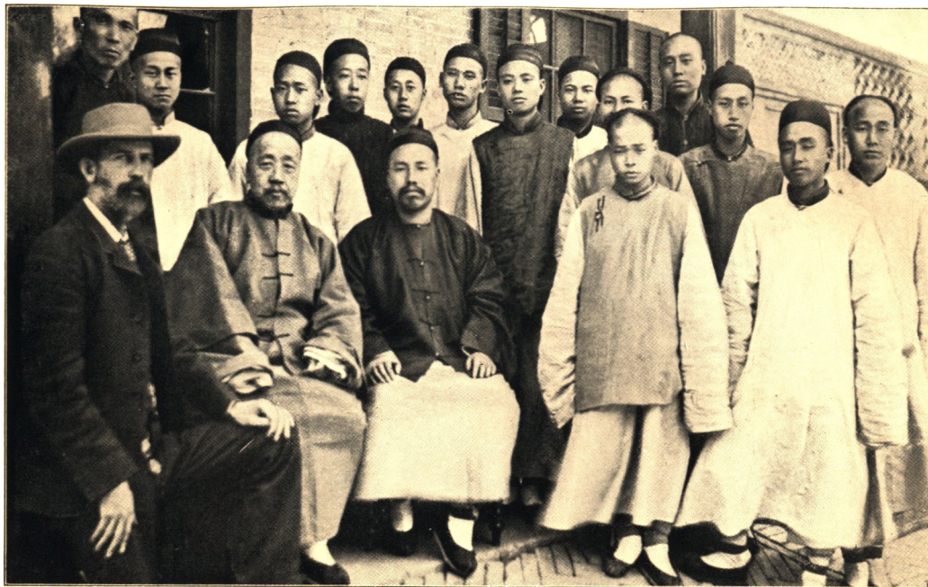
SØOFFICERS-EKSAMEN I TIENTSIN.