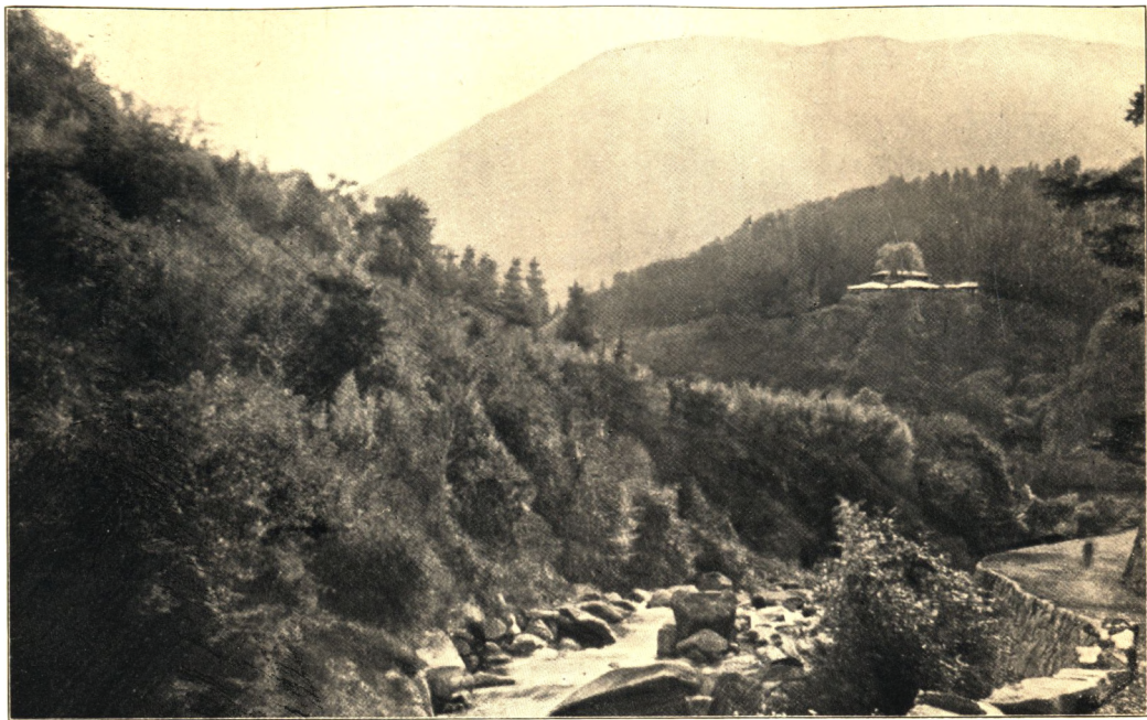
KIGA VED MIYANOSHITA.