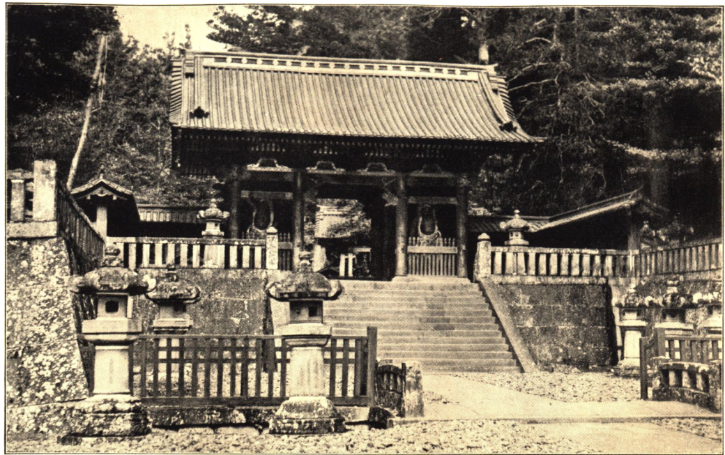
INDGANG TIL IYEMITSUS TEMPEL. NIKKO.