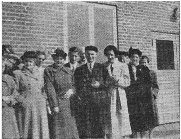
Et lille udsnit af deltagerne foran Østerskompagniets bygninger.

Efter programmet skulle der aflægges besøg på Østers-Kompagniet kl. 14½, hvor flaget vajede til ære for os. Trods det, at