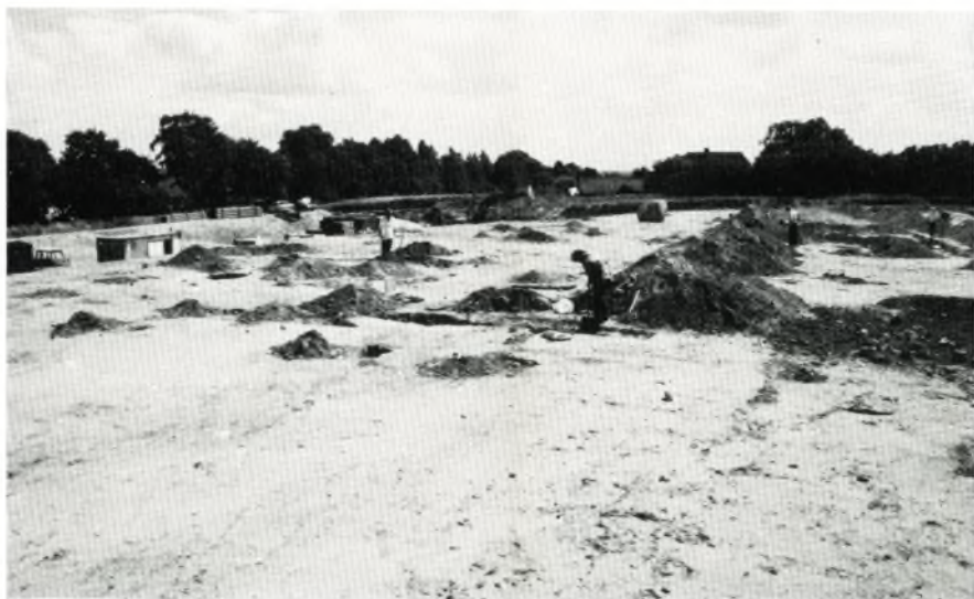
Fig. 2. Oversigt over udgravningsfeltet på højningen på Coloplast-grunden ved »Dageløkke Mølle«.

Dageløkke Mølle. I løbet af sommeren 1990 gennemførte Nordsjællandsk Folkemuseum udgravning af en bebyggelse fra yngre bronzealder og ældre jernalder på det lokalplanområde, hvor nu Coloplast's nye fabriksbygning ligger. Undersøgelsen blev gennemført i godt samarbejde med og finansieret af Coloplast og Rigsantikvaren (fig. 2).