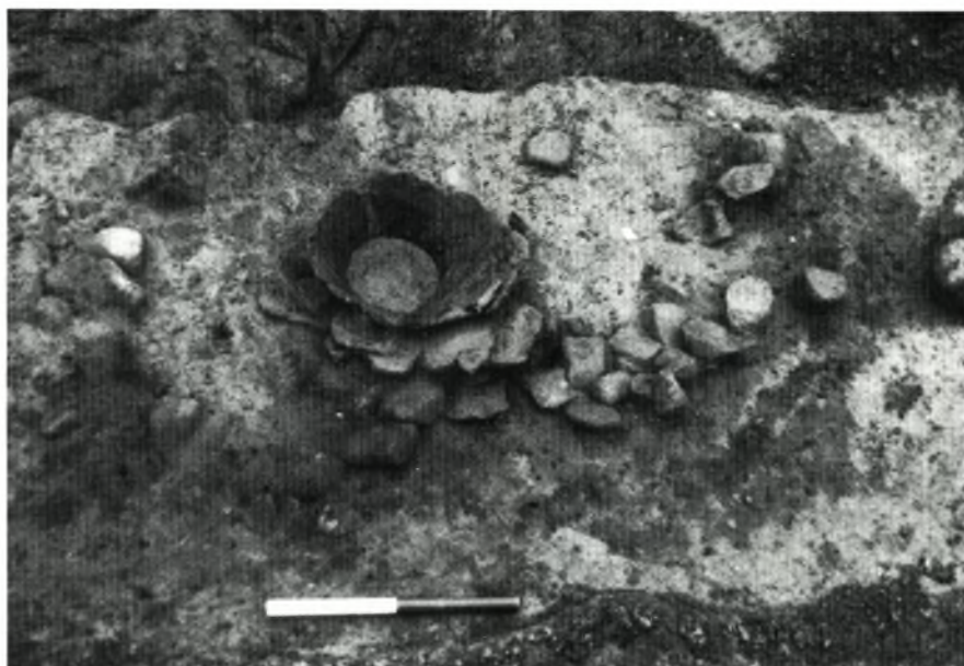
Fig. 5. Bunden af gravurne ompakket med afbrækkede potteskår. Fundet på lokaliteten »Nyholmgård II«.

udsnit af bopladsen, og selv om der på baggrund heraf er formodning om, at vi har spor efter bygninger, lader dette sig ikke dokumentere med sikkerhed.