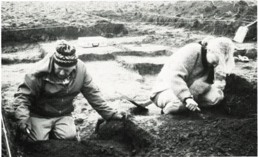
Fig 1. Lokale arkæologiinteresserede i færd med at udgrave potteskår på Graftebjerg.

produceret i områderne umiddelbart syd for Østersøen eller er hjemlige produkter lavet efter forbilleder fra dette område. Keramiktypen tilhører den sene vikingetid og den ældre middelalder (ca. 900-1200 e.Kr.f.).