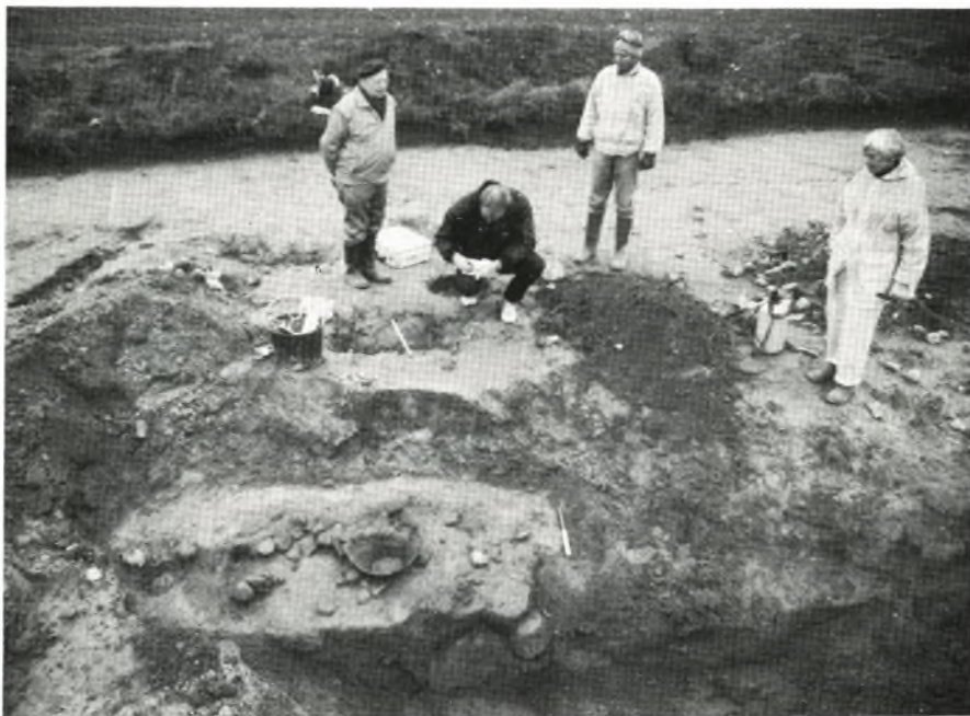
Fig. 4. Lokale arkæologiinteresserede i færd med udgravning af affaldsgrube med rester af gravurne på lokaliteten »Nyholmgård II«.

Nyholmgård II. På samme mark og blot få hundrede meter fra lokaliteten »Nyholmgård I« undersøgtes, ligeledes på en lille højning, et ca. 1000 kvadratmeter stort areal med spor efter bebyggelse fra ældre jernalder. Igen havde vi kun lejlighed til at undersøge et ca. 15-20 meter bredt