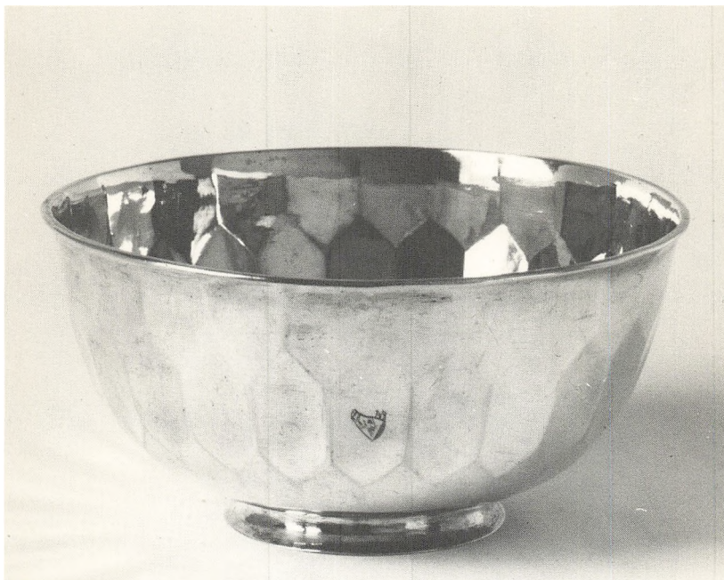
Fig. 7. Rund skål, diameter 17,5 cm, med facetteret corpus og glat fodring i Museum für Kunst und Gewerbe, Hamburg. Det eneste arbejde, der hidtil har været tilskrevet Hans Fischer, guldsmed i Hamburg 1713-31.